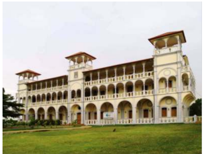
Seminario de Banapá.