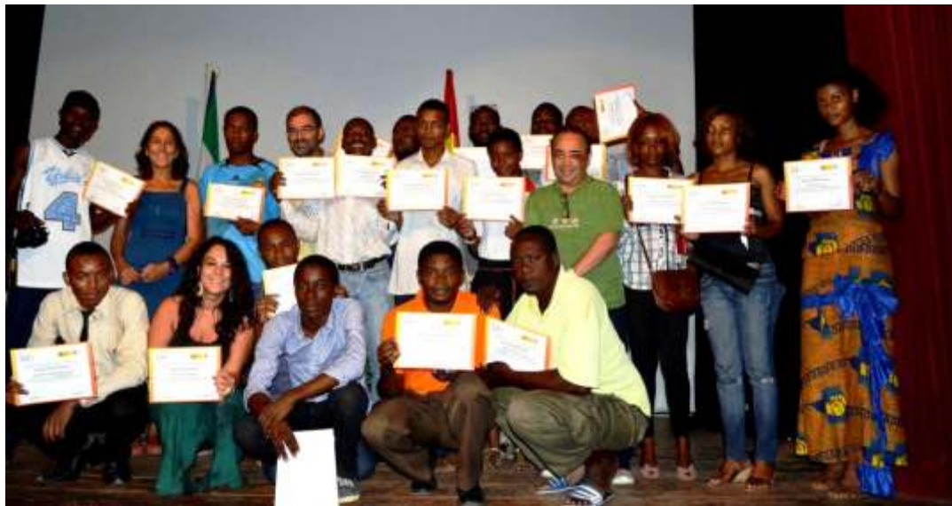
Arriba: algunos de los alumnos/as de los cursos de la APC recogiendo su diploma el 26 de noviembre. Abajo: alumnos y profesores de los cursos APC

Se han desarrollado cinco talleres de: Géneros televisivos: Documental y reportaje, del 16 al 27 de abril, Iniciación al periodismo digital, del 21 de mayo al 1 de junio, Locución y edición de audio del 2 al 13 de julio, El reto de la comunicación y el periodismo en la era digital del 1 al 11 de octubre y Tratamiento digital de imágenes del 20 al 30 de noviembre.