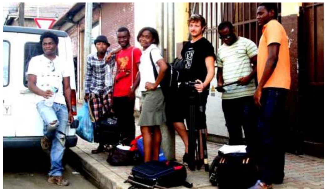
Equipo de ACIGE en la grabación durante el mes de noviembre de varios cortometrajes sobre VIH para UNICEF

Cine Itinerante Sur Sur de Guinea Ecuatorial" denominado FECIGE. FECIGE es un festival que tiene como objetivo acercar el cine al público proyectando películas en los espacios o lugares comunes de las grandes ciudades del país para garantizar el máximo acercamiento del público hacia este arte, es decir "si Mahoma no va a la montaña, la montaña va a Mahoma".