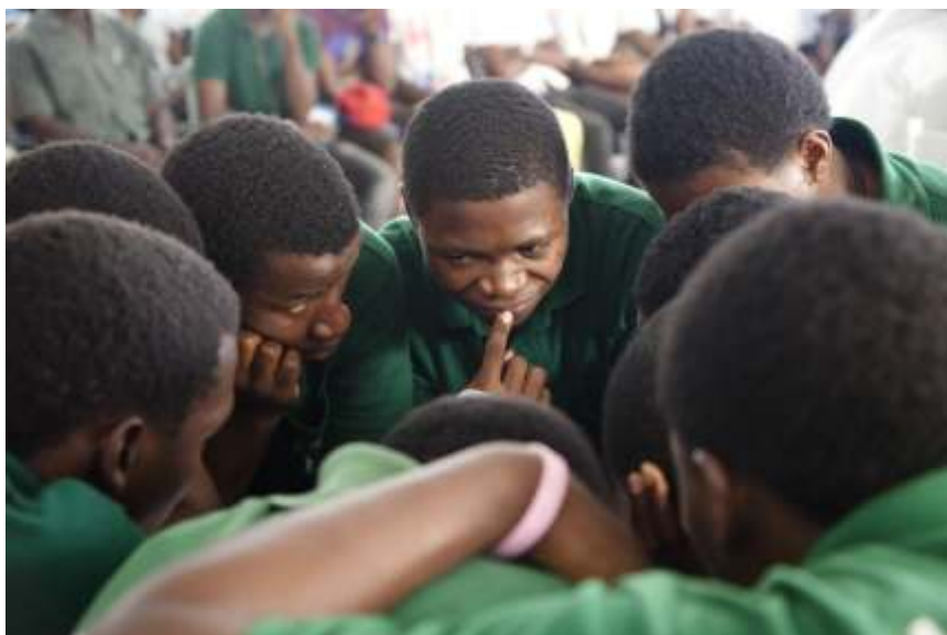
Arriba: alumnos/as del Colegio Claret de Niefang en la final celebrada en Mongomo. Abajo: grupo participante del INES Mongomo

Este concurso literario entre colegios es una cita obligada para los centros escolares y el CCEB desde el año 2005.