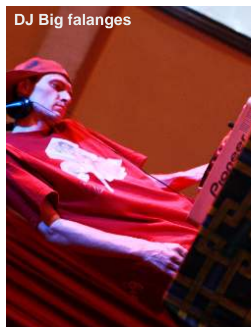
DJ Big falanges