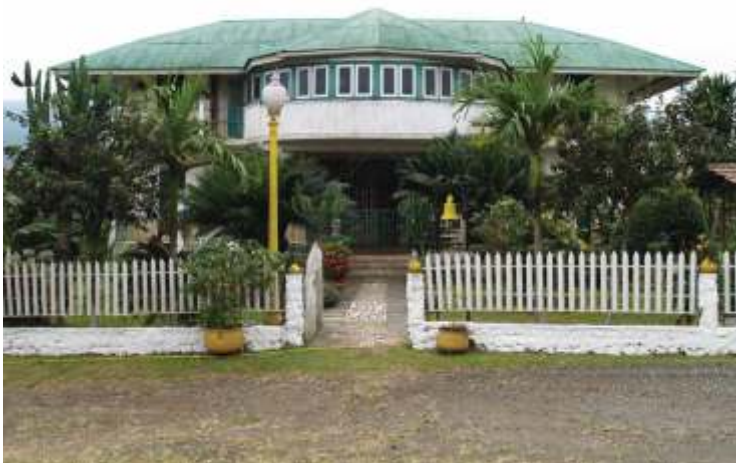
Vivienda vernácula en Moka.