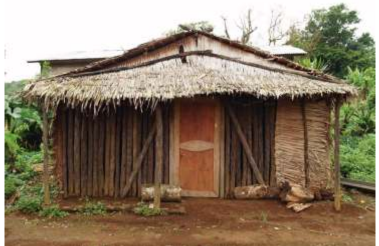
La Gaditana.