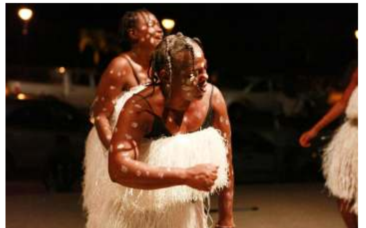
Arriba: Danza tradicional bubi con el grupo Bisila