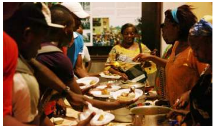
Degustación gastronómica de platos bubis