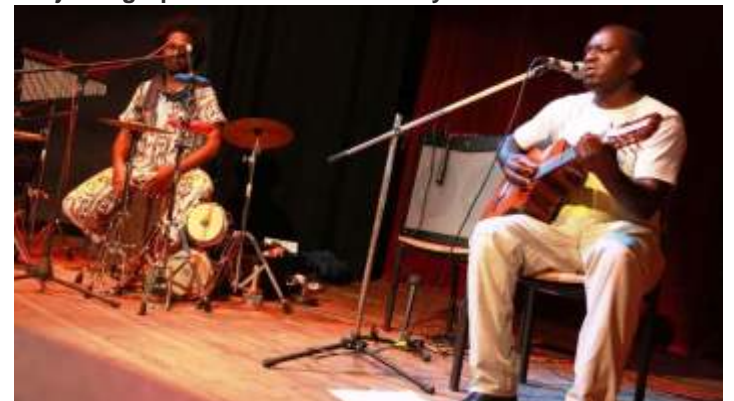
Abajo: El grupo malabense Bolebó System