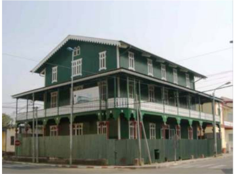
Casa Verde.

Se repartirán ejemplares gratuitos para los asistentes.