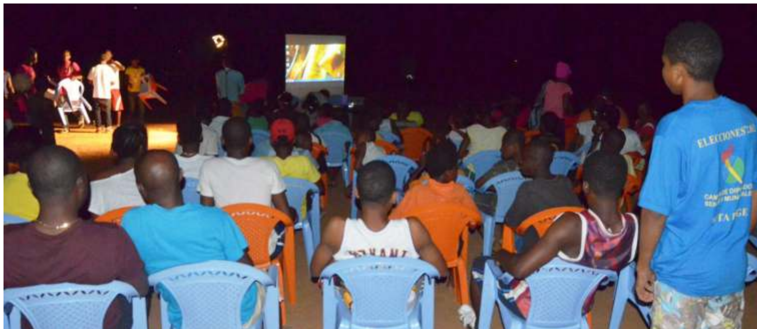
Proyección del FECIGE en el Campo de la Salle en Lea ( Bata)

Del 6 al 15 de junio, las plazas, calles, colegios y centros culturales de Guinea Ecuatorial se llenaron de cine. Del mejor cine ecuatoguineano, africano e iberoamericano actual. Volvía mejorado y ampliado, el FECIGE, la cita anual más destacada del sector audiovisual en el país.