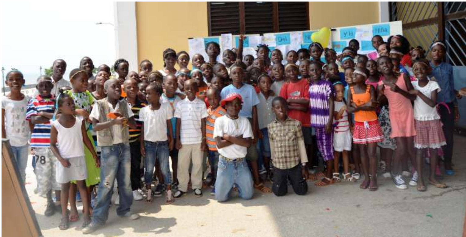
Más de cien niños participaron en la celebración del Día del Niño Africano el 15 de junio

El 16 de junio de 1976 en Soweto (Sudáfrica) miles de escolares negros se manifestaron para protestar por la inferior calidad de su educación y para reclamar su derecho a ser educados en su propia lengua. La represión de las autoridades sudafricanas fue brutal y cientos de niños y jóvenes fueron asesinados.