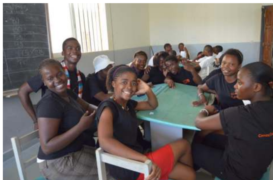
Chicos/as del INES de Mongomo en la final del Concurso en la Región Continental el 4 de mayo