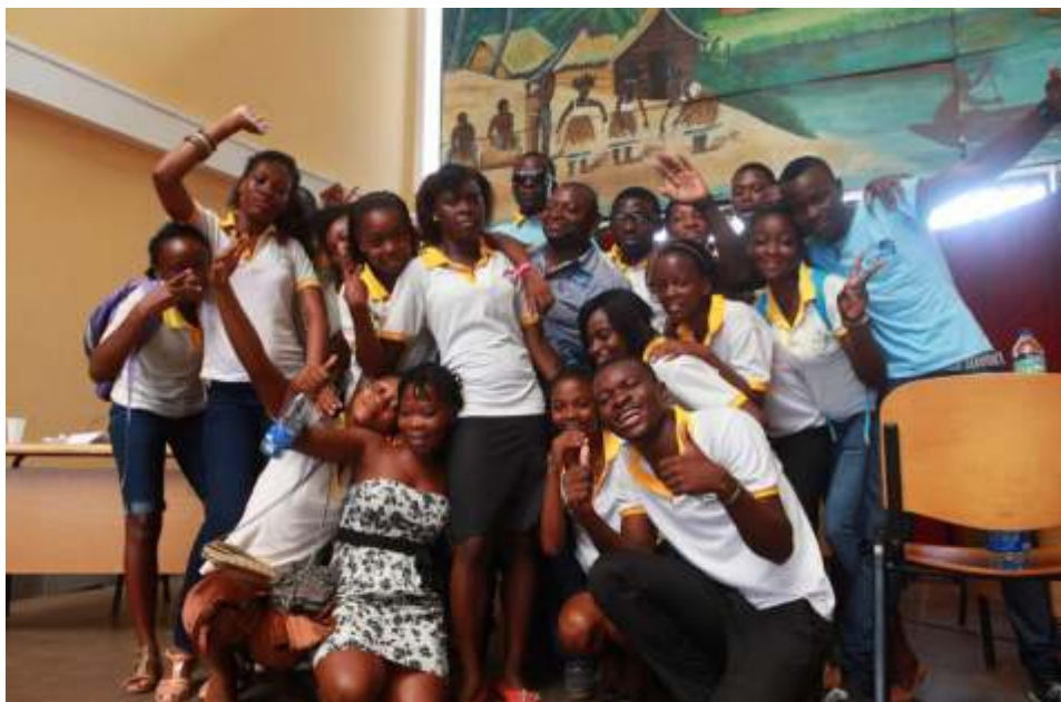
Alumnos/as del colegio Eco de futuro, tras su victoria el 27 de abril en Bata

En el mes de enero el CCEB envió a los centros escolares participantes una selección de diez clásicos de la literatura fantástica y de terror. El concurso valora la comprensión lectora de los alumnos y premió a aquellos que fueron capaces de contestar correctamente al mayor número de preguntas sobre las obras.