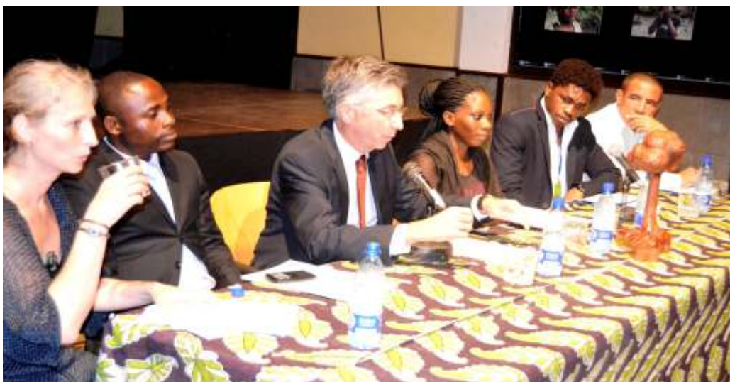
Mesa inaugural de FECIGE: Directora del CCEM, Inspector General de Cultura y Turismo, Embajador de España en Guinea Ecuatorial, Representante del CCEG, Presidente de ACIGE, Responsable de la cooperación educativa de Cuba.