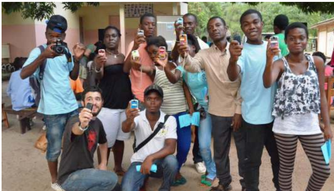
Grupo de alumnos/as del taller de realización audiovisual básica desarrollado durante el FECIGE en Bata