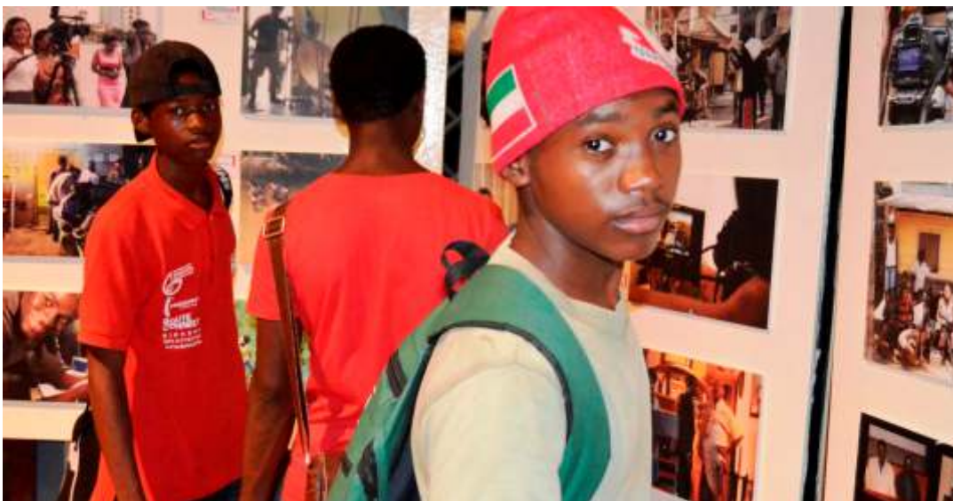
Exposición fotográfica "Guinea Rueda" con imágenes de rodajes que han tenido lugar en Guinea en los últimos años.