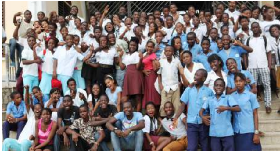
Alumnos/as participantes en la pasada edición del festival

Del 24 al 29 de junio el teatro escolar inundará de nuevo las tardes de la ciudad de Bata. Vuelve renovado y reforzado el Segundo Festival de Teatro Escolar "Ciudad de Bata" organizado en colaboración con la Asociación "Actores del Milenio".