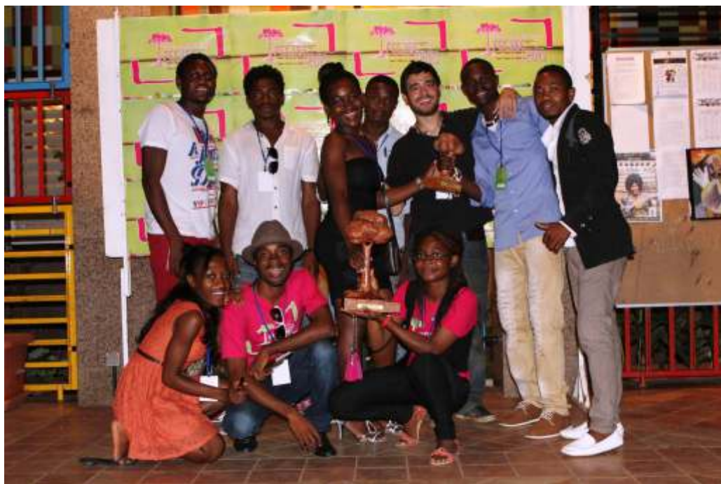
Miembros de ACIGE sosteniendo el Premio Ceiba del jurado premio al mejor cortometraje, que fue para "Lámpara"

Conscientes del importante valor sensibilizador del cine, esta nueva edición del FECIGE incluyó la sección especial "Salud y Medio ambiente" en la que se proyectarán varios cortometrajes de sensibilización sobre el VIH, la salud mental y la conservación de la biodiversidad en Guinea Ecuatorial.