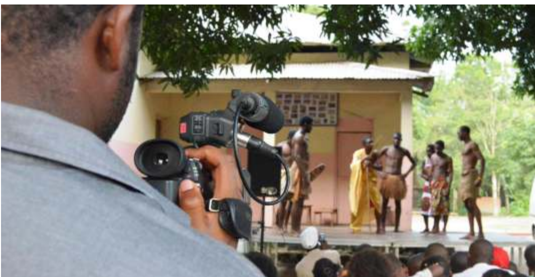
Último día del FECIGE en Bata, con la Cia teatral 7º Arte y su obra "Un pasado"