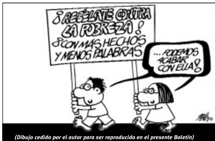
(Dibujo cedido por el autor para ser reproducido en el presente Boletín)

Ayer y hoy del Cine Mejicano. Una selección de las obras más representativas de la historia del cine mexicano. Lugar: Instituto Cervantes.