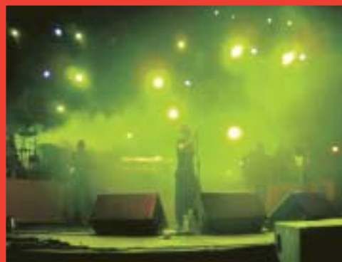
Chambao en una de sus actuaciones

Cómo acabar con la pobreza será el título de la mesa-sesión inaugural, el fin último que rige la labor de la cooperación, que dará paso a otras mesas de debate: La Cooperación Española es cosa de todos y todos, La orientación social y humana de la Cooperación Española, A retos globales alianzas multilaterales, Una ayuda eficaz y de calidad, Cultura, Comunicación y Cooperación al Desarrollo y El reto medioambiental para la Cooperación Española. Al hilo de este Encuentro, tendrá lugar el concierto solidario que la asociación Voces dará en el Palacio de Deportes de la Comunidad de Madrid con Chambao, Antonio Orozco o Jarabe de Palo, entre otros, como artistas invitados.