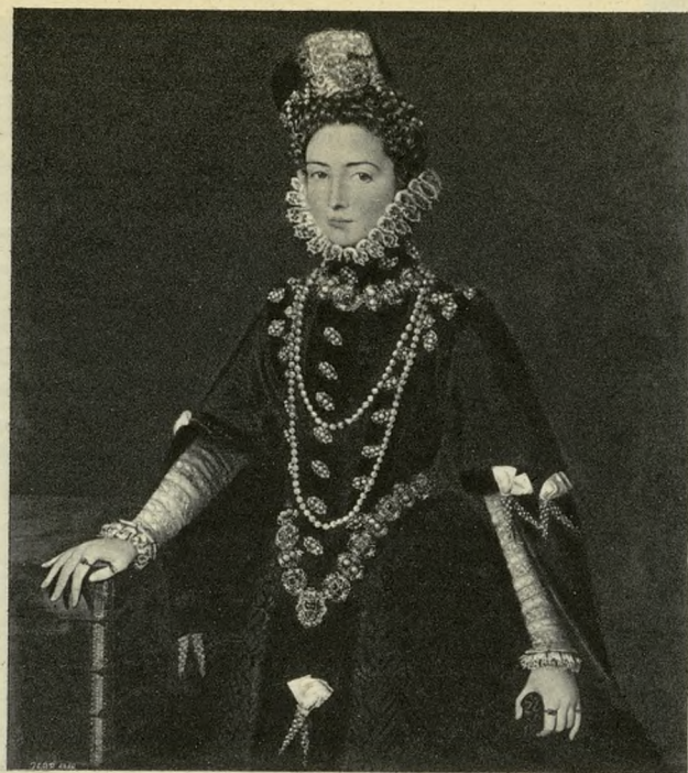
A la izquierda: SANTA CATALINA, por Hernando Yáñez.—En el centro: LA INFANTA D.ª CATALINA MICAELA, por Sánchez Coello.—A la derecha: SANTA CASILDA, por Zurbarán.—Abajo: SAN JOSE CON EL NIÑO, por Ribera.