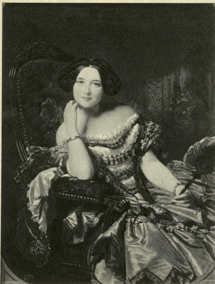
CONDESA DE VILCHES, por Federico Madrazo.