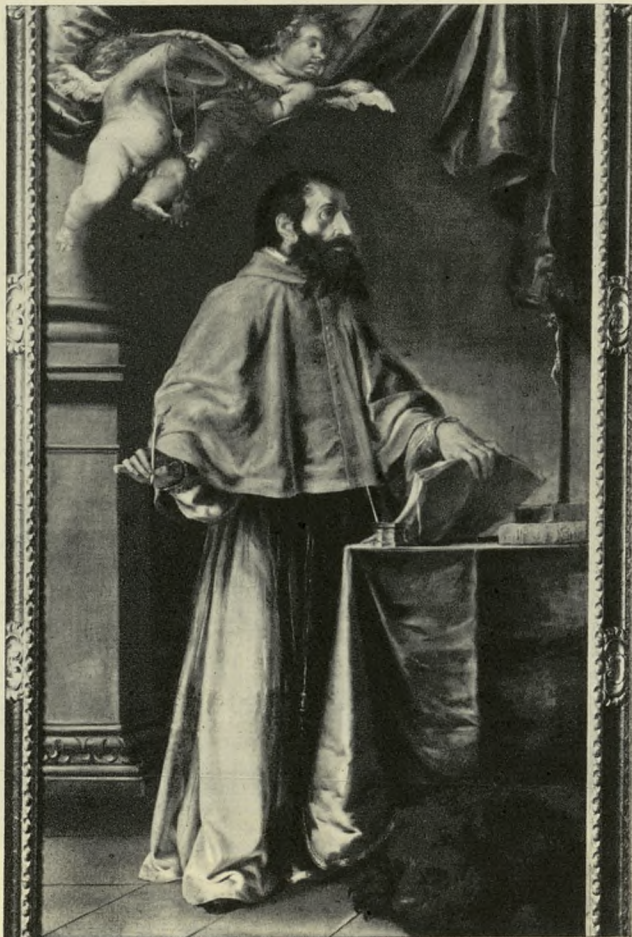
SAN JERONIMO, por Valdés Leal.

La gran sala central del Prado presenta una antología casi perfecta de la pintura española en el momento en que, en la transición al XVII, empieza su vuelo creador, su definición como gran escuela del barroco pictórico en Europa; ahora el genio español va a expresar su visión del mundo en las ásperas imágenes devotas, llenas de grandiosidad humana y fuerza realista. Así se manifiesta en las pinturas de Ribalta, el precursor del tenebrismo naturalista español ( Visión de San Francisco ), continuado por la obra de su seguidor, el setabense Jusepe Ribera, quien, partiendo del violento claroscuro tenebroso, acabará en un pintor de claras diafanidades y de rica paleta colorista. En el Museo del Prado, su San José con el niño , la Visión de San Francisco , el Santiago el Mayor y, sobre todo, el San Andrés , de vigorosa factura insuperable, nos muestran al Ribera tenebroso; el Martirio de San Bartolomé , obra capital, muestra ya la tendencia a escenas con fondo de aire libre, lo mismo que la insólita representación del Sueño de Jacob en un paisaje diurno; sus dos Magdalenas penitentes , la Trinidad o el Isaac y Jacob son