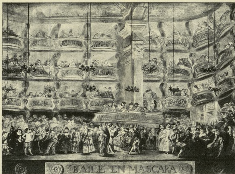
BAILE EN MASCARA, por Luis Paret.

Desde las pinturas de Maderuelo, la pequeña ermita románica del XII, con su acento bizantino y su grandiosidad decorativa, a la inverosímil tablita de Fortuny que acabamos de mencionar, el Prado nos ofrece lecciones pictóricas que abarcan no menos de siete siglos de arte europeo, contando en este dilatado recorrido la obra casi completa de dos genios de la pintura, tan indestronables como Velázquez y Goya lo son. No es mal balance.