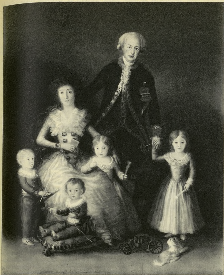
FAMILIA DE LOS DUQUES DE OSUNA, por Goya.