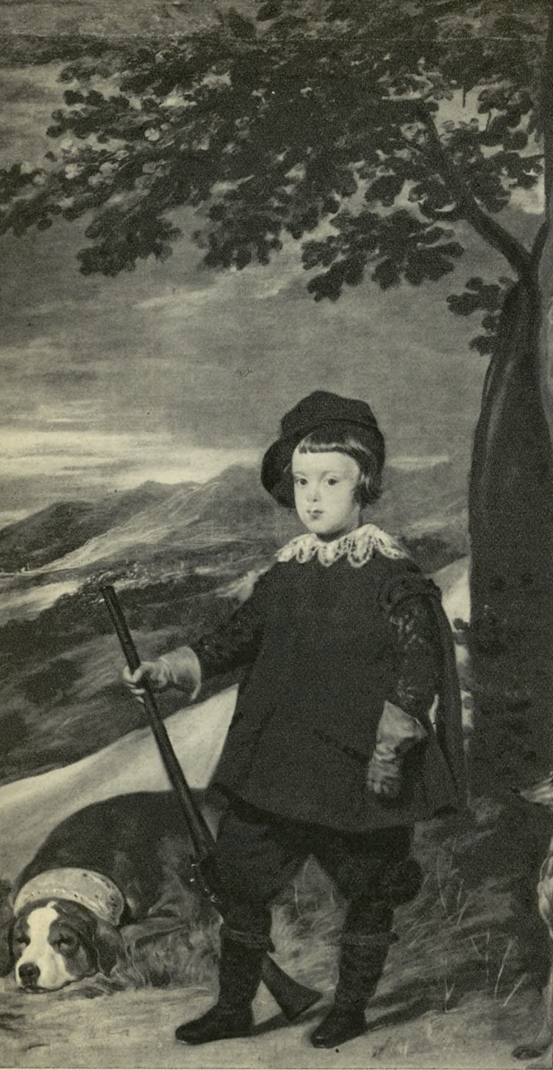
En esta página ofrecemos tres lienzos de Velázquez. Arriba: EL PRINCIPE BALTASAR. — Abajo: PAISAJE DE LA VILLA DE MEDICIS. — A la derecha: Fragmento de LAS LANZAS.