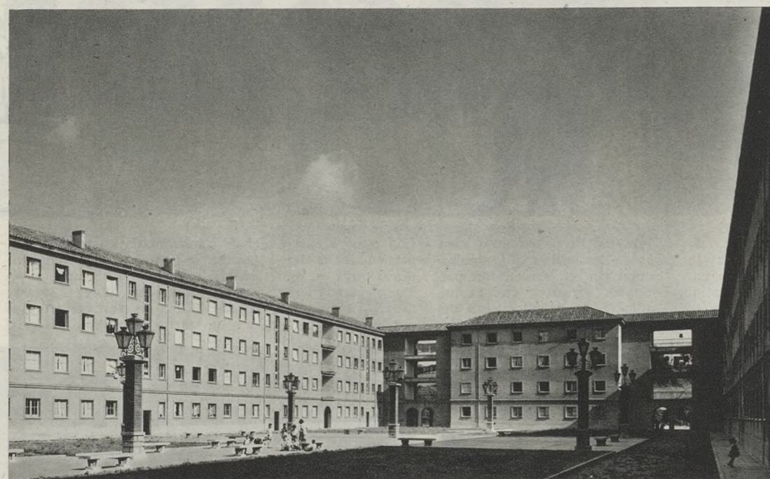
OVIEDO: SANTA BARBARA.