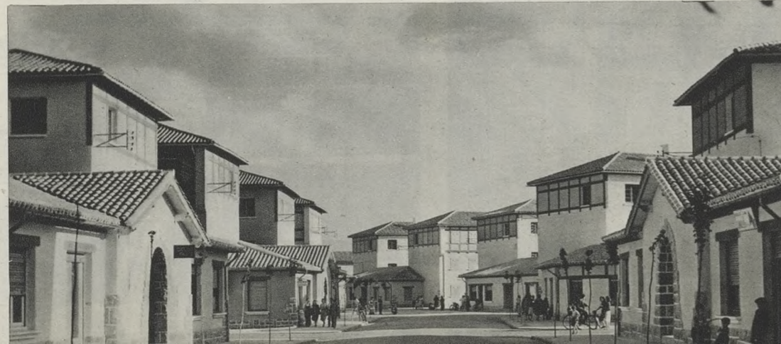
PAMPLONA: «LA CHANTREA»

de Renta Limitada, surgida en la experiencia anterior y después de contrastar lo realizado en España con las iniciativas y formas utilizadas en otros países, ha venido a constituir la más avanzada legislación en esta materia. Ello, ha creado un clima nacional que mantiene en el primer orden de la actualidad a la vivienda, no ya por conciencia del problema, como venía sucediendo, sino por la esperanza, que empieza a definirse en silueta de realidad auténtica, de una urgente solución.