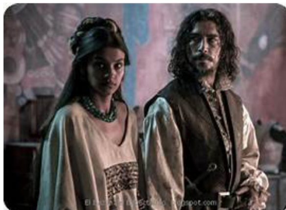
Doña Marina y Hernán Cortés en Hernán (2019).

Hernán Cortés y Pedro de Heredia 2 . En efecto, ambas indígenas nacidas y vividas en el mismo período cronológico; ambas esclavas, conocedoras de idiomas, intérpretes de ambos hombres al español; cristianizadas y renombradas y, en cierto modo, desarraigadas en parte