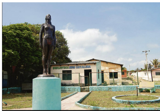
Galerazamba. Biblioteca "India Catalina"