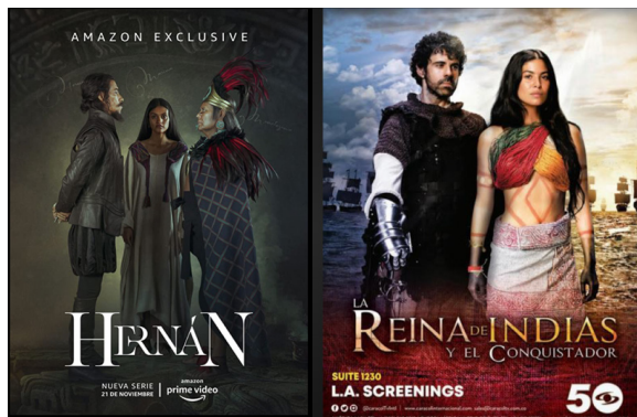
Series televisivas Hernán (2019). Trailer disponible en https://www.youtube.com/watch?v=qRII1SIVEdc y La reina de Indias y el conquistador (2020). Trailer disponible en https://www.youtube.com/watch?v=Q2wdl6BuGwE

En el presente artículo presentamos los aspectos relativos al nombre cristiano y español de ambas, así como su papel de lenguas o intérpretes de los conquistadores Cortés y de Heredia, todo ello desde la metodología de la lectura crítica y del aprovechamiento de lo multimedia que comprende el texto, la fotografía, la música y el video. Y, como base primordial de reflexión, los contenidos correspondientes en las series Hernán (TV Azteca/Amazon Prime Video, 2019) y La reina de Indias y el conquistador (Netflix, 2020).