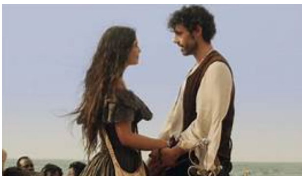
La india Catalina y Pedro de Heredia en La reina de Indias y el conquistador (2020).

Una aproximación comparativa 1 entre ambas mujeres arroja de inmediato un paralelismo evidente en sus vidas junto a dos conquistadores como