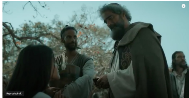
Hernán (2018). Entrega de esclavas, bautismo e imposición del nombre de Marina. "Y tu te vas a llamar Marina". En https://www.youtube.com/watch?v=weMQ7nrlyB0&t=329s , 17.37/21.51.

Los nombres nuevos recibidos por ambas mujeres responden a su proceso de cristianización y españolización, pero la elección de los mismos se produce por el procedimiento habitual de adaptación a la fonética de quien se los impone. En el caso de Marina el punto de partida es su nombre indígena, Malinalli, derivado a Malintzin y Marina como adaptación a la fonética castellana. Como se sabe, al término de la batalla de Centla (Tabasco), el 15 de marzo de 1519, los indios establecen la paz con los españoles mediante una serie de regalos entre los que figuran la donación de veinte esclavas que, una vez bautizadas, Cortés entrega a sus capitanes. Marina pasa al dominio de Puertocarrero. En el video a continuación se representa la adjudicación del nombre de Marina en el acto litúrgico del sacramento del Bautismo.