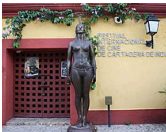
La india catalina en el Festival Internacional de cine de Cartagena.