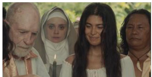
La reina de Indias y el conquistador Episodio 3. https://www.netflix.com/watch/81203775