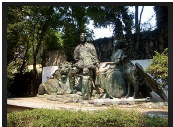
Monumento a Cortés, Doña Marina y Martín Cortés en el parque de Churubusco, Ciudad de México.