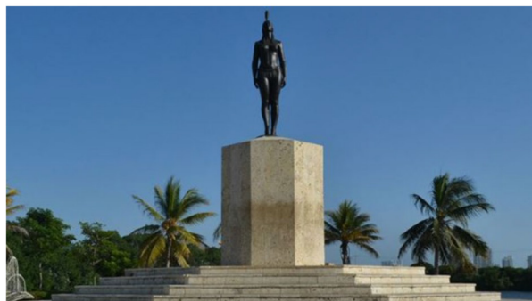
Monumento a la india Catalina en Cartagena de Indias

Esculturas de la India Catalina y Doña Marina en ciudades colombianas y mexicanas.