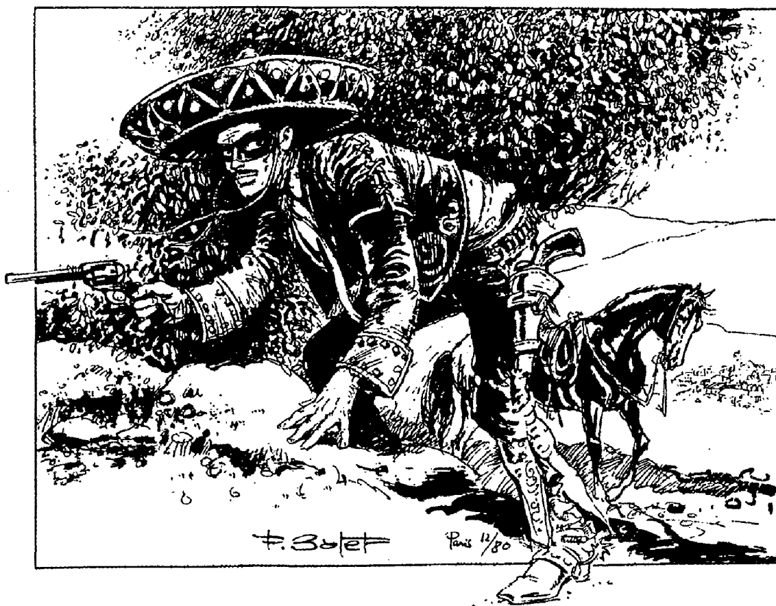
Francisco Batet: El Coyote (1980)

Tal pesimismo evita el riesgo de las ilusiones y de las frustraciones, puesto que baja el nivel de las expectativas humanas. Se trata, creo, sin embargo, en Machado, de un pesimismo que no lleva al conformismo y a la pasividad, sino que es activo y contiene elementos de inconformidad.