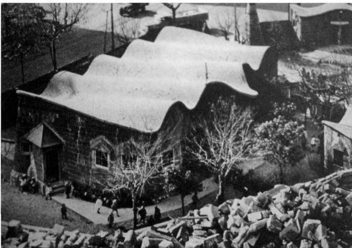
Escuela de la Sagrada Familia

La inabarcable figura de Gaudí comprende muy disímiles registros, a menudo contradictorios entre sí: junto al arquitecto integrador de las artes (cabe cifrar en ello su admiración por el ideal romántico de Richard Wagner)