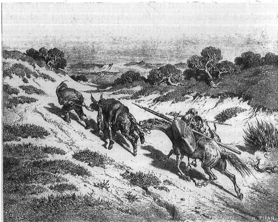
Gustavo Doré: Grabado

Quizá sintiera lástima. Cuando el gran energúmeno ruso a quien la gloria recuerda con el nombre de Dostoievski dijo que Don Quijote de La Mancha es el libro más grande y más triste del mundo, sin duda había advertido que aquel alcabalero manco había com-