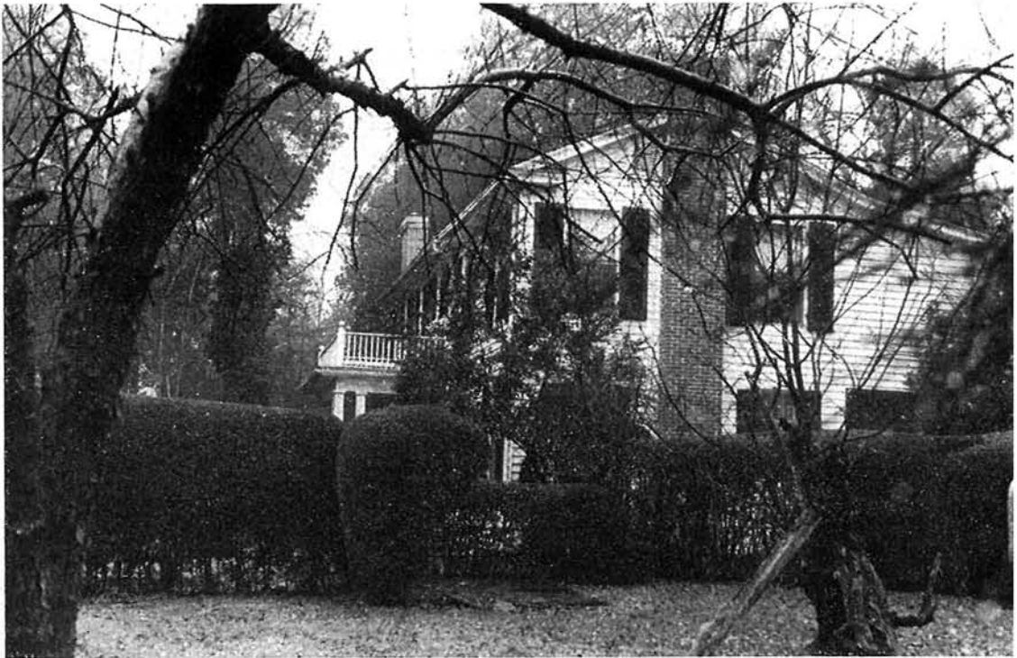
Al costado de la casa del escritor está todavía el peral caído, sostenido por un tutor, que Faulkner admirara por su resistencia y entereza en vencer la adversidad