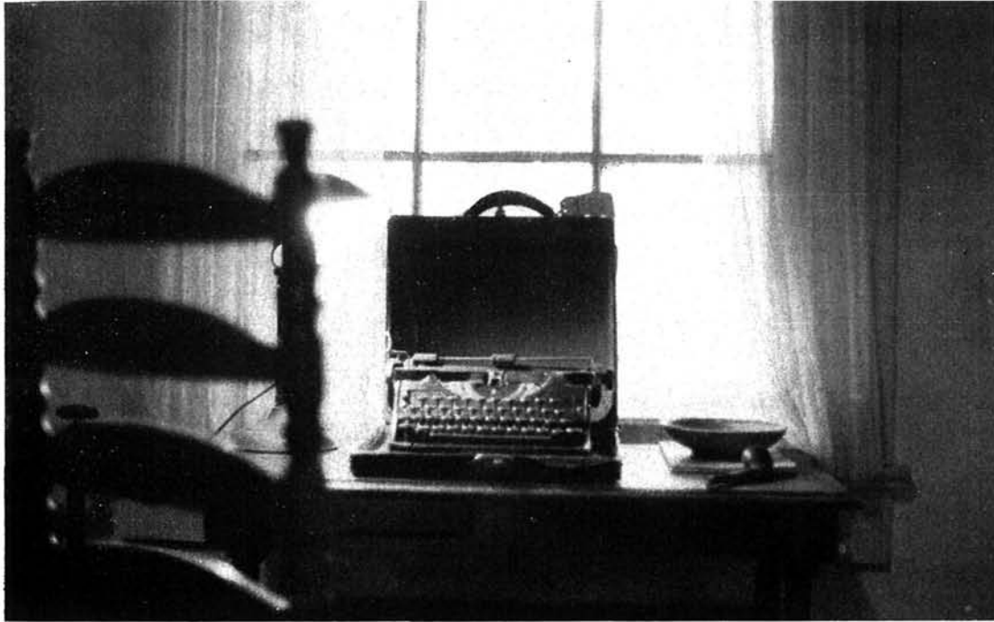
La máquina de escribir del novelista, su pipa, tal como quedó el día su muerte: abierta frente a la ventana de su jardín