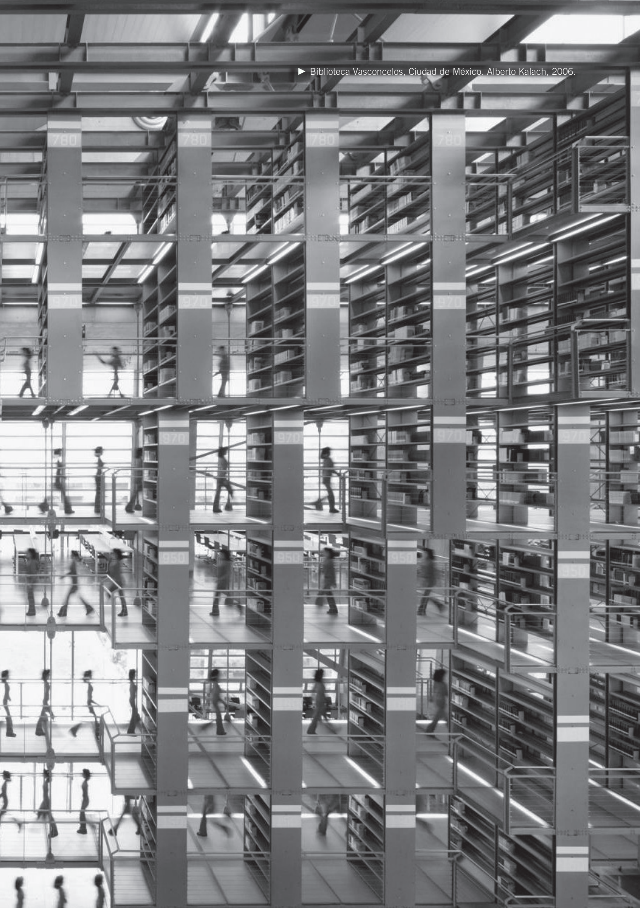
► Biblioteca Vasconcelos, Ciudad de México. Alberto Kalach, 2006.