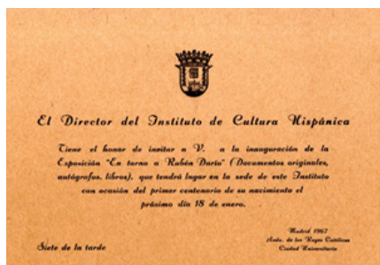
Invitación a la exposición "En torno a Rubén Darío", 1967

Medio siglo ha transcurrido desde que en 1965 el Instituto de Cultura Hispánica adquirió alrededor de ciento veinte documentos relacionados con Rubén Darío que poseía Luis Díez de Pinedo. Hoy duplican con creces esa cantidad los custodiados en la Biblioteca de la AECID. No parecen haber recibido especial atención, aunque buena parte de ellos se exhibieron en la exposición «En torno a Rubén Darío» con que en 1967 se conmemoró el centenario del nacimiento del poeta. La revista Cuadernos Hispanoamericanos le dedicó entonces su número 212-213 (agosto-septiembre), que no se hizo eco de ese material. Autógrafos de José María Vargas Vila, Luis Bonafoux y Emilia Pardo Bazán ahí incluidos se reprodujeron en el número extraordinario (el 234, septiembre de 1967) de Mundo Hispánico dedicado a Darío, donde Antonio Oliver Belmás, director del Seminario-Archivo instalado en la Universidad Complutense de Madrid, hizo alguna referencia a esos documentos y a los que Alberto Ghirardo se había llevado a América.