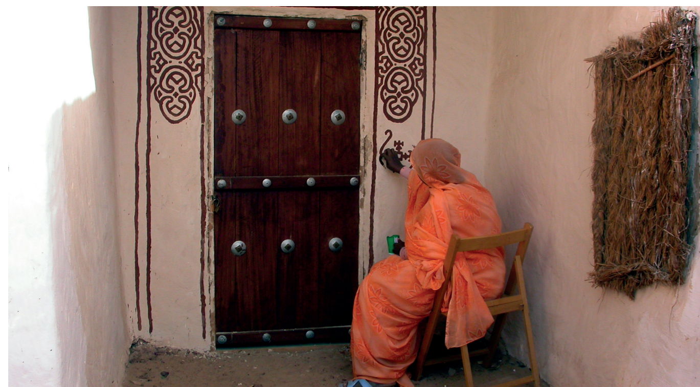
Participación ciudadana en la recuperación del centro histórico de Wallata (Mauritania)