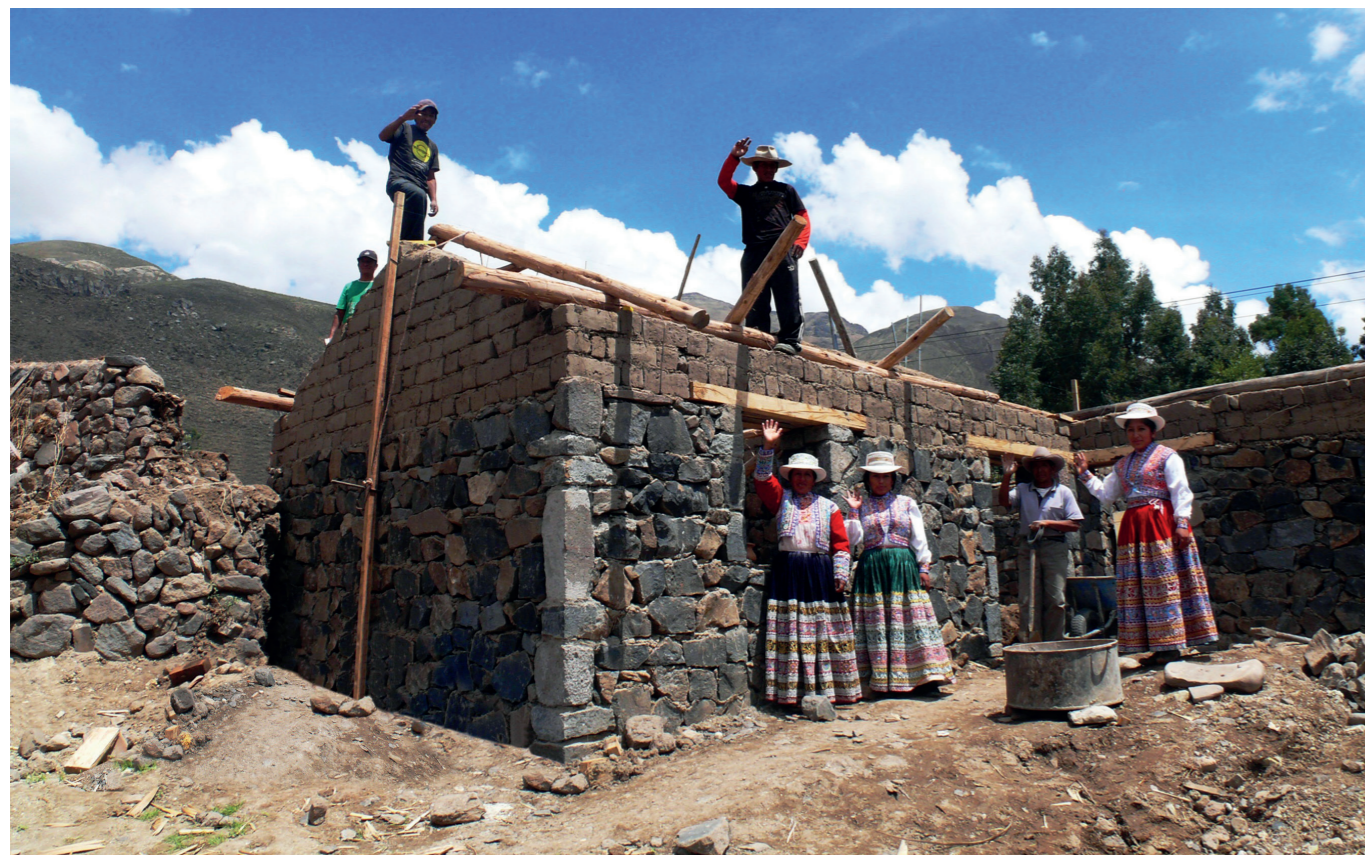
Programa de vivienda rural y desarrollo social en el Valle del Colca (Perú)

El Programa Patrimonio para el Desarrollo (P>D) se concibe como un instrumento de la Agencia Española de Cooperación Internacional para el Desarrollo (AECID) en su contribución al desarrollo sostenible y la lucha contra la pobreza, a través de la utilización del patrimonio cultural como generador de progreso de las comunidades depositarias del mismo. Para ello se apoyan acciones de puesta en valor y gestión sostenible del patrimonio cultural, orientadas tanto a mejora de la habitabilidad, el fortalecimiento institucional, las capacidades de gestión y la generación de ingresos, así como a la protección de la identidad, el legado cultural y la memoria colectiva.