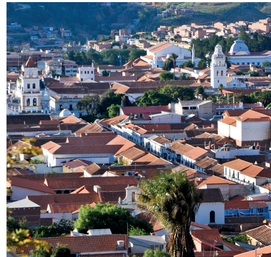
Apoyo al Plan de Rehabilitación de las Áreas Históricas de Sucre (Bolivia).

Estas intervenciones se desarrollan con una participación directa de la ciudadanía y las comunidades locales en los programas de conservación del patrimonio y de recuperación de la memoria colectiva, identificando y replicando buenas prácticas para las políticas culturales inclusivas. Tal es el caso del proyecto iniciado con las bibliotecas de manuscritos de Chinguetti (Mauritania), en el que el Programa ha actuado como