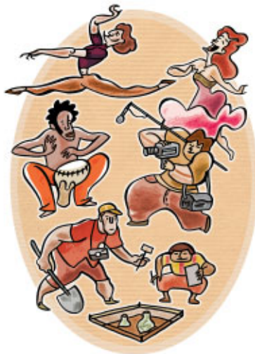
Ilustración: Guillermo del Olmo

En el marco de estas convocatorias, la Dirección General de Relaciones Culturales y Científicas contribuye a la realización de proyectos y actividades relacionados con el fomento de la cooperación cultural y científica y se respaldan iniciativas del sector cultural vinculadas a procesos de desarrollo. Los ámbitos temáticos son de índole muy variada, y abarcan desde