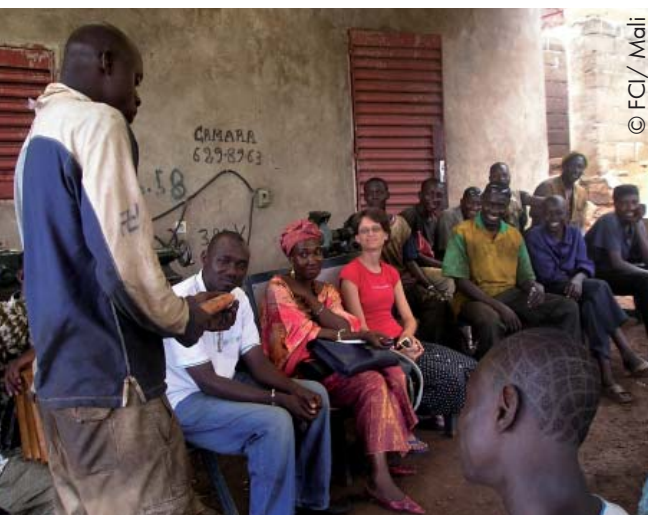
El equipo de InterArts

El proyecto de Mopti (Mali) busca desarrollar estrategias de SSR, incidiendo en la cultura como elemento transversal, para jóvenes vulnerables que trabajan en el sector informal. El objetivo es dotar a este colectivo de herramientas que posibiliten su acceso a la información mediante una educación adaptada al contexto multicultural de la ciudad, compuesto de diversas etnias, creencias y sistemas de valor distintos. La sexualidad entre los jóvenes no casados se considera tabú en muchas culturas tradicionales de Mali, en el que influyen sobremanera los líderes religiosos que actúan de referentes culturales. Por ello, parte fundamental del proyecto consiste en buscar un diálogo cultural entre los diferentes grupos sociales y construir un proceso de capacitación adaptado a la cultural local. La capacitación se realiza en talleres con jóvenes en los cuales se usan maneras creativas para fomentar la sensibilización sobre enfermedades de transmisión sexual, embarazos no deseados y enfoques de género.