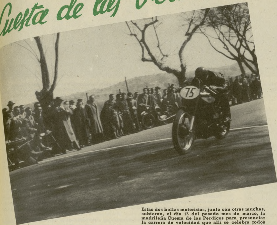
Estas dos bellas motoristas, junto con otras muchas, subieron, el día 13 del pasado mes de marzo, la madrileña Cuesta de las Perdices para presenciar la carrera de velocidad que allí se celebra todos los años organizada por el Real Moto Club de España. El motorista Juan Kutz (número 75) cubrió el recorrido (1.106 metros) en 24 segundos, a una velocidad media de 160 kilómetros por hora.