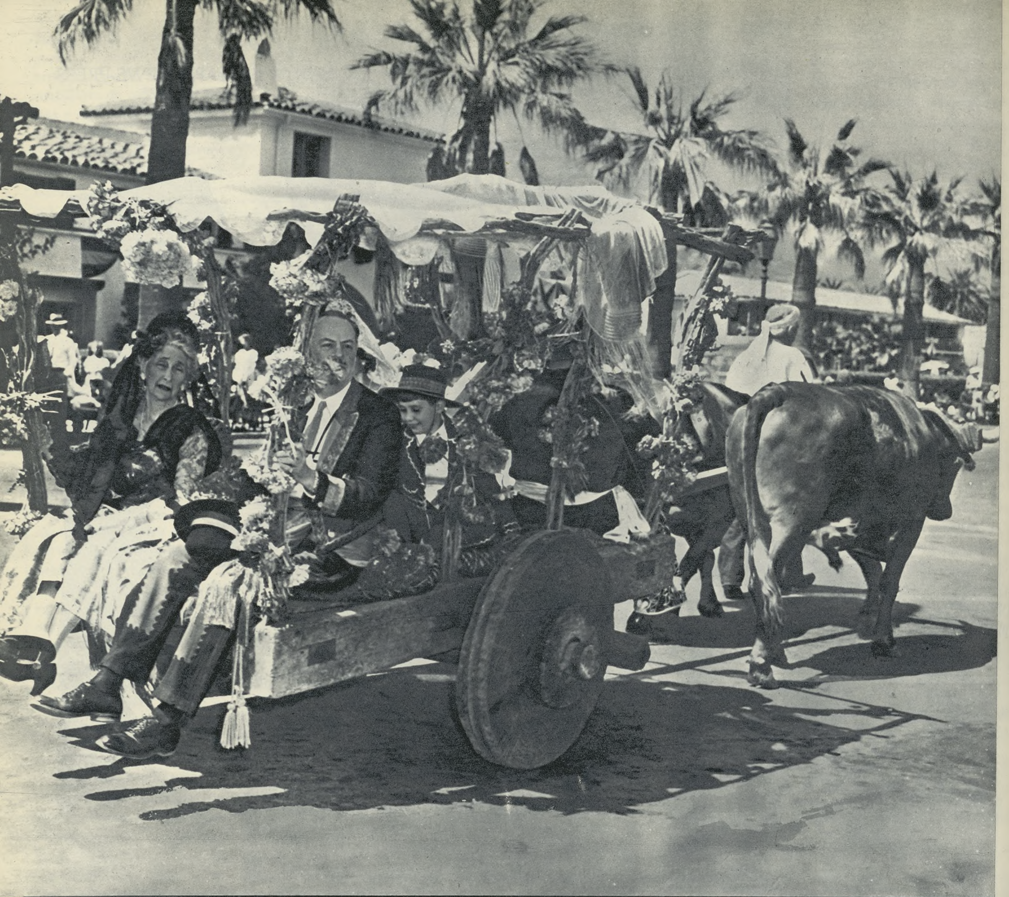
Antigua familia española, de Santa Bárbara de California, sobre una de las carretas que formaron en la cabalgata conmemorativa de los «Old Spanish Days Fiesta».