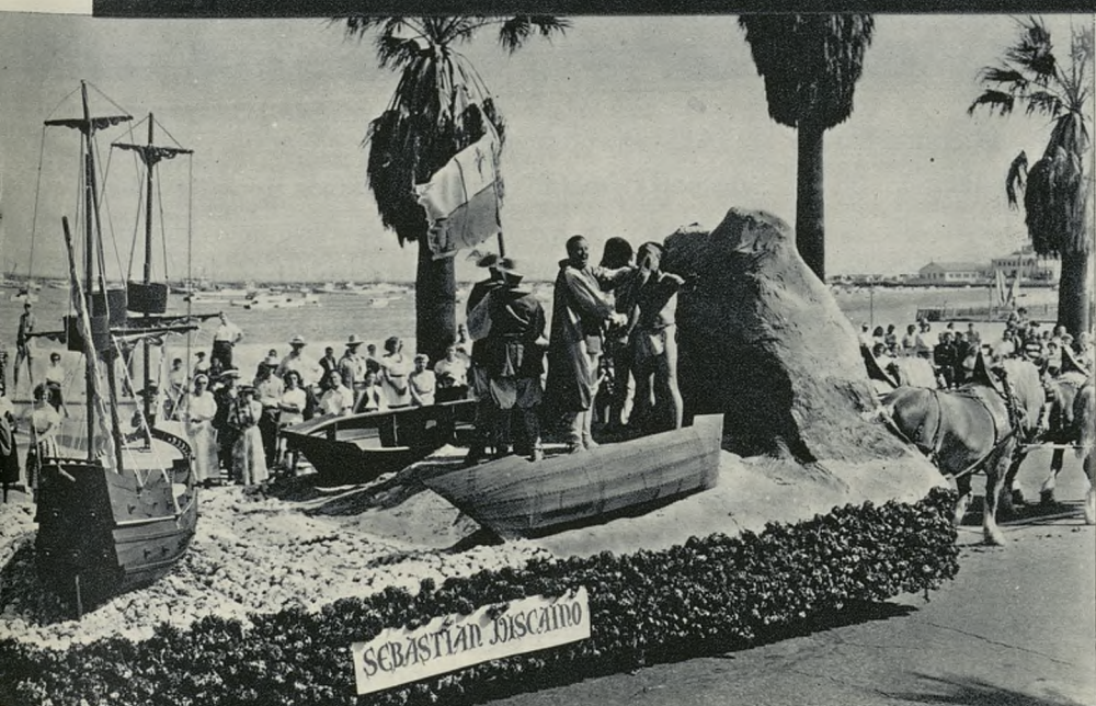
El desembarco del navegante español Sebastián Vizcaíno, representado en el desfile.