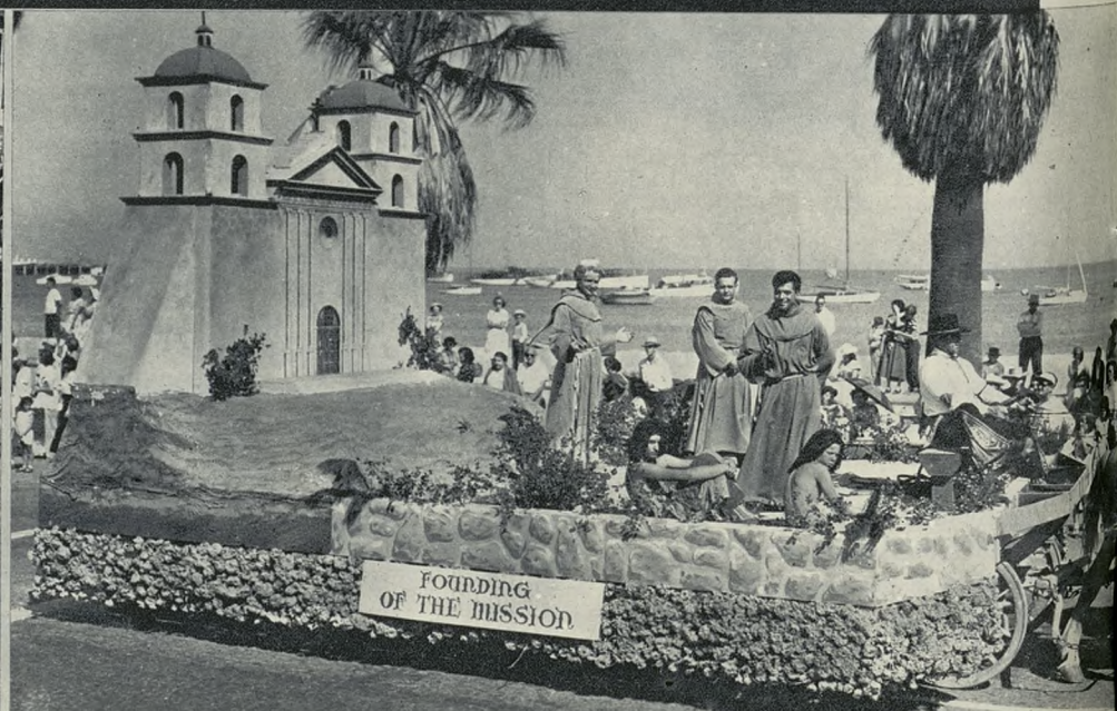
Carroza conmemorativa de la fundación, por Fray Junípero, de la Misión de Santa Bárbara.