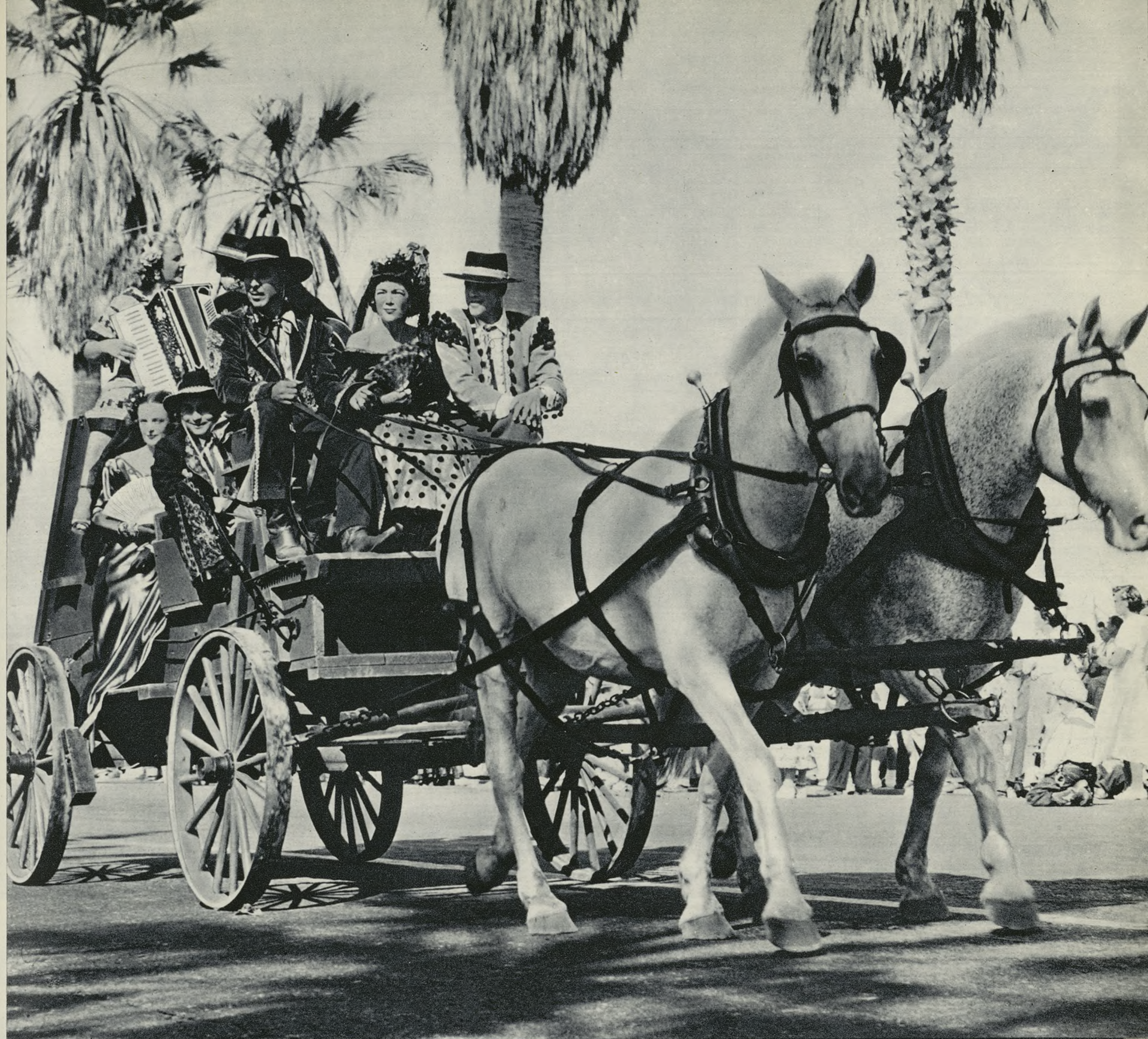
Sobre un fondo de palmeras, una carroza, tirada por brioso tronco de caballos, luce en el desfile una familia ataviada con los trajes típicos de Andalucía