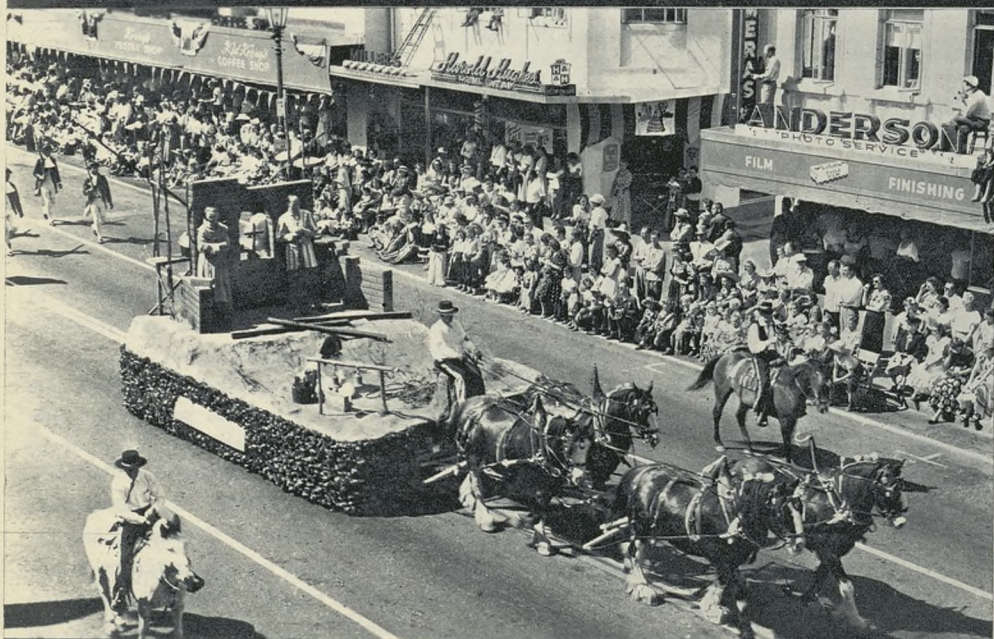
Carroza conmemorativa de la fundación, por los españoles, del fuerte de la ciudad.