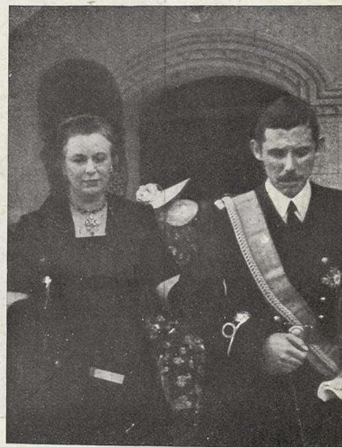
Cristóbal Colón dando el brazo a su madre.

—Es una duquesa de Veragua del siglo XVIII... Descendiente en línea directa del Almirante.