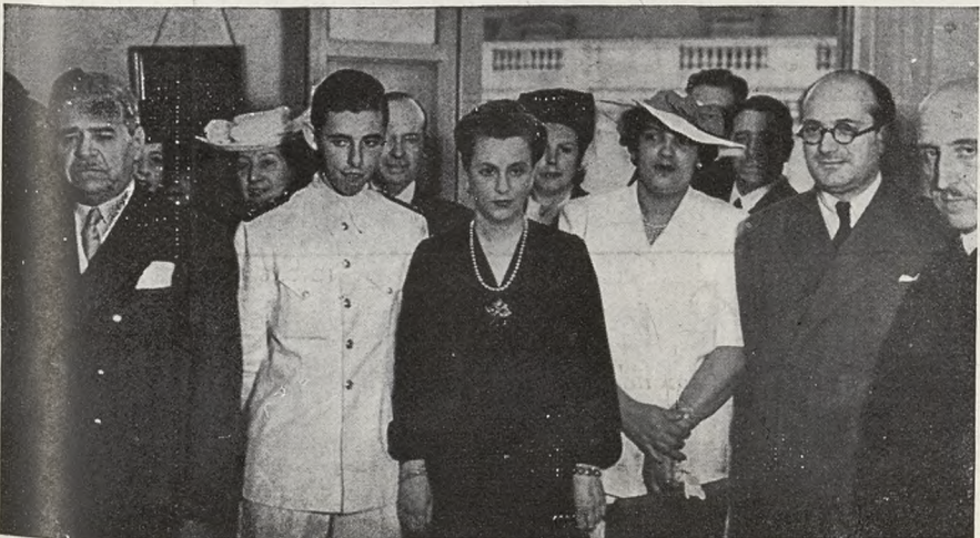
En su casa madrileña, los duques de Veragua, con el Ministro de Educación Nacional español, Sr. Ibáñez Martín; el embajador de Santo Domingo y señora de Morell.