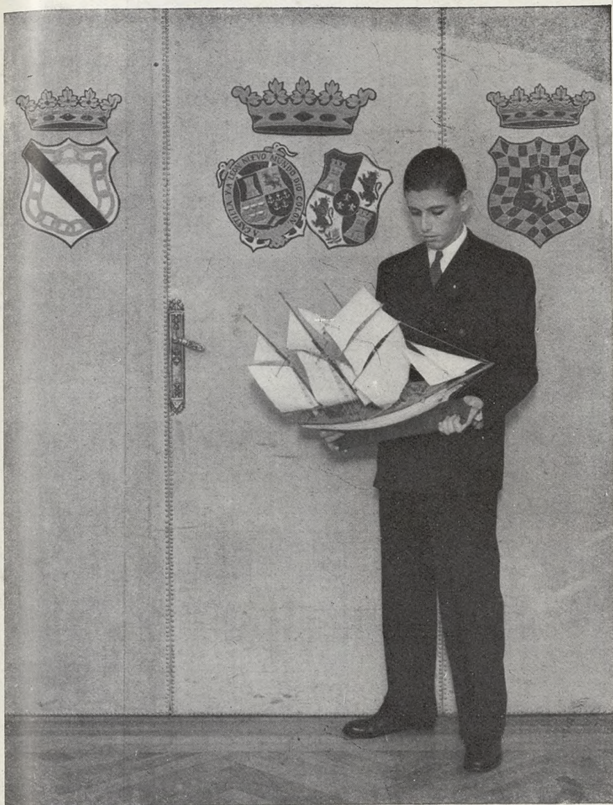
El duque de Veragua, a los dieciocho años, examina un barquito construido por él mismo.