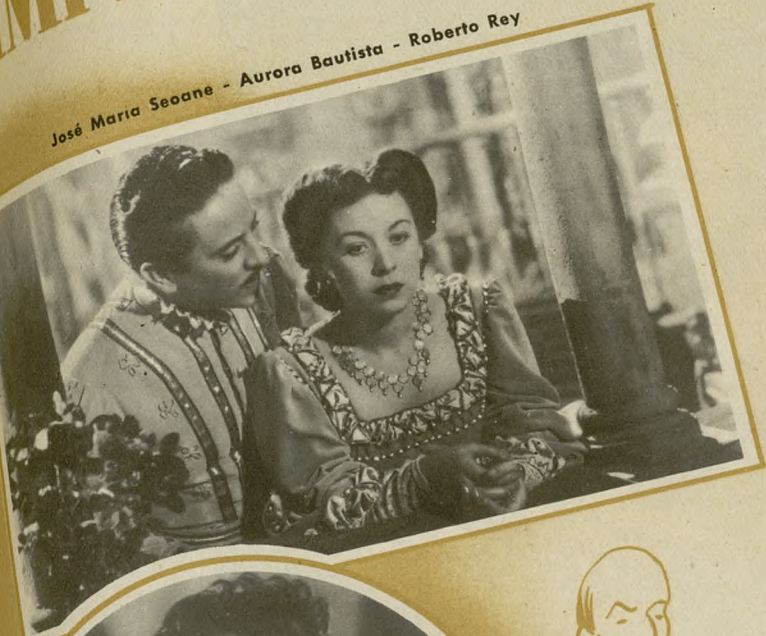
José María Seoane - Aurora Bautista - Roberto Rey