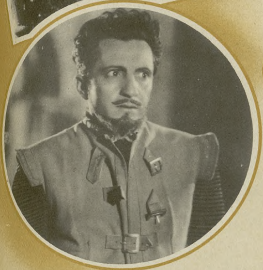
Director: Calzavara - Operador: Lombardi