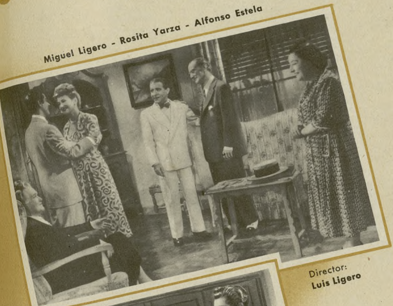
Director: Luis Ligeró

La labor eficiente y eficaz de Valencia-Films, su orientación, su criterio y su noble ambición de superarse, ha hecho que el Círculo de Escritores Cinematográficos fije en ella su atención y la distinga—única productora española que ha recibido este galardón— con el Premio Gimenó. Valencia-Films es hoy día, en España, una de las firmas productoras de más prestigio, de más solvencia y, desde luego, la que mejor sabe entender el cine, porque sabe entender al público.