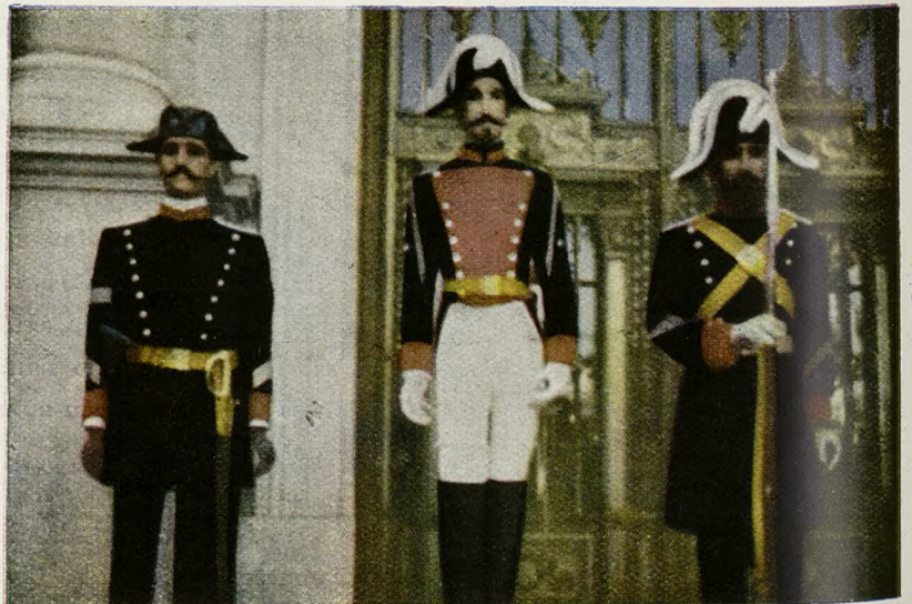
El uniforme de la Guardia Civil ha sufrido diversas modificaciones. La foto recoge tres modelos, que se conservan en el Museo del Ejército, de Madrid.