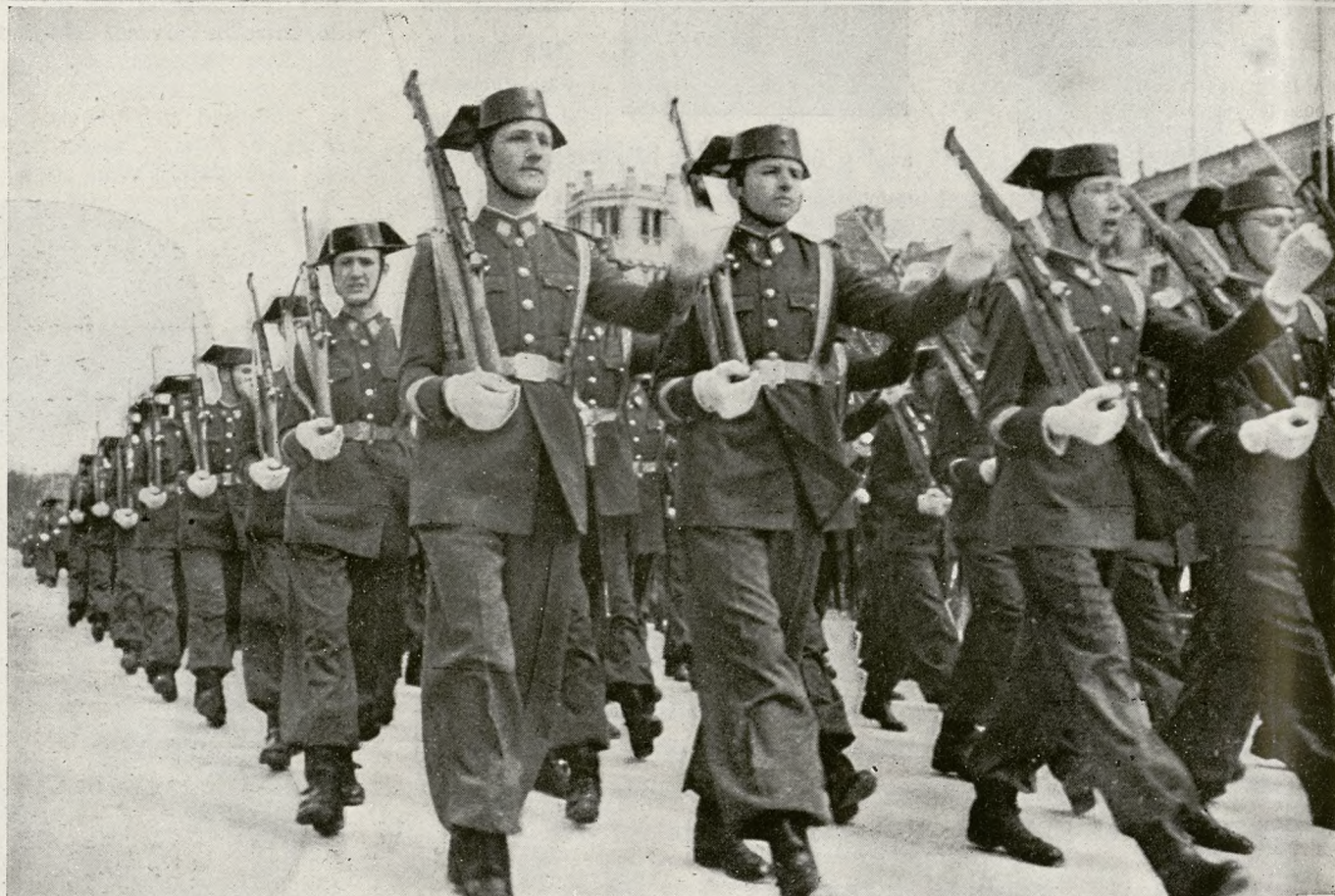
Arriba: Una pareja de la Guardia Civil, en servicio de vigilancia de carreteras, se toma un descanso, junto a la casilla de camineros.—Abajo: La Guardia Civil participa en un desfile de fuerzas armadas durante las fiestas de la Victoria.

fama por la ingenua fantasía popular consiguió que, ante esa misma sencilla imaginación del pueblo, los guardias civiles estuvieran ya para siempre cubiertos de gloria y leyenda de valentía. Pero más que la evocación de tales proezas, más que el lance, no por novelesco menos real, de la lucha con notorios delincuentes, representa hoy la Guardia Civil la protección vigilante del suelo nacional en todo tiempo y lugar. La silueta de la pareja de guardias civiles, tan familiar por los caminos españoles, es un seguro de confianza para toda gente pacífica y honrada. Por ti cultivan la tierra, — la Patria goza de calma, se canta justamente en loor del benemérito Instituto en la letra de su himno. Y este prestigio, logrado por la constancia en el diario servicio oscuro, anónimo y eficaz, es lo que ha hecho universal el renombre de la Guardia Civil. Y lo que hace llegar a los Gobiernos españoles, en el presente como en épocas anteriores, peticiones de asesoramiento de otros países que desean constituir fuerzas de orden público a imagen y semejanza de la Benemérita.