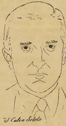
Joaquín Calvo Sotelo