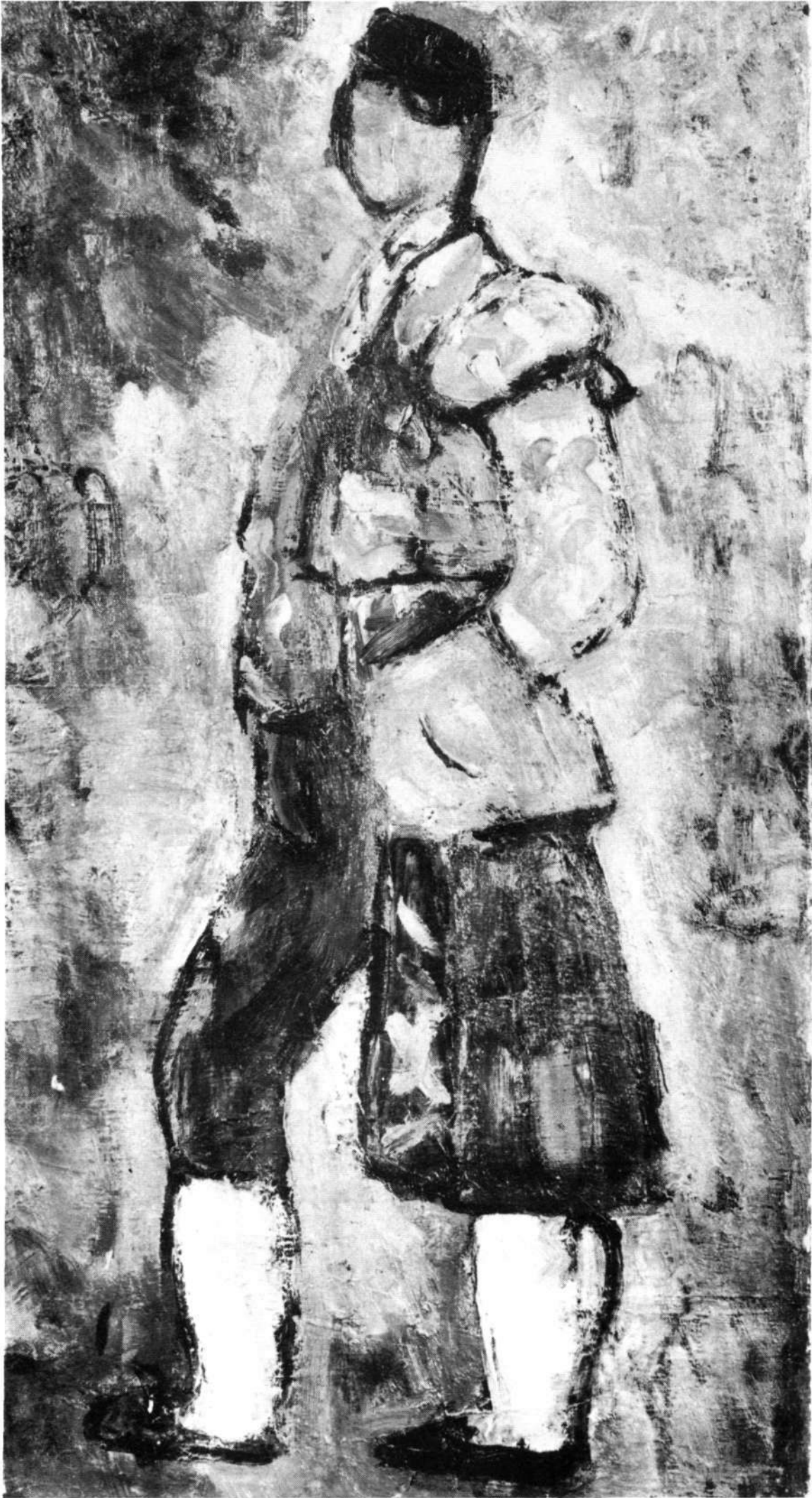
SEMPERE: «Torero». óleo (1950).