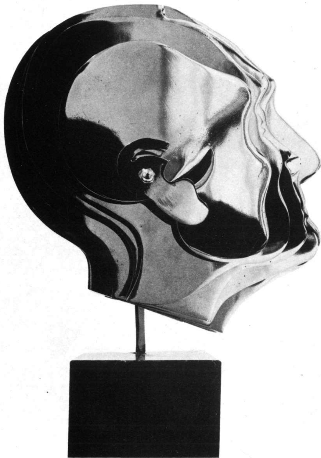
SEMPERE: «Azorín», múltiple (1974). Acero cromado, 28 × 25 cm.