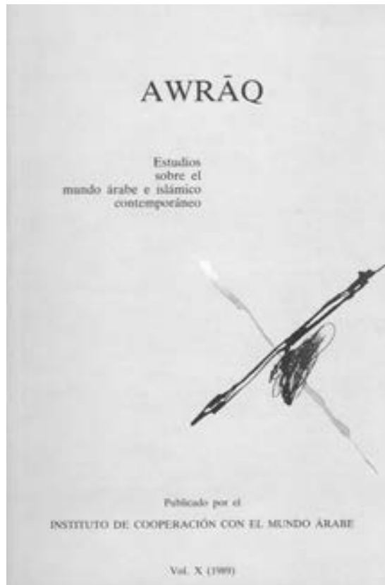
Portada del volumen X de la revista Awraq (1989).