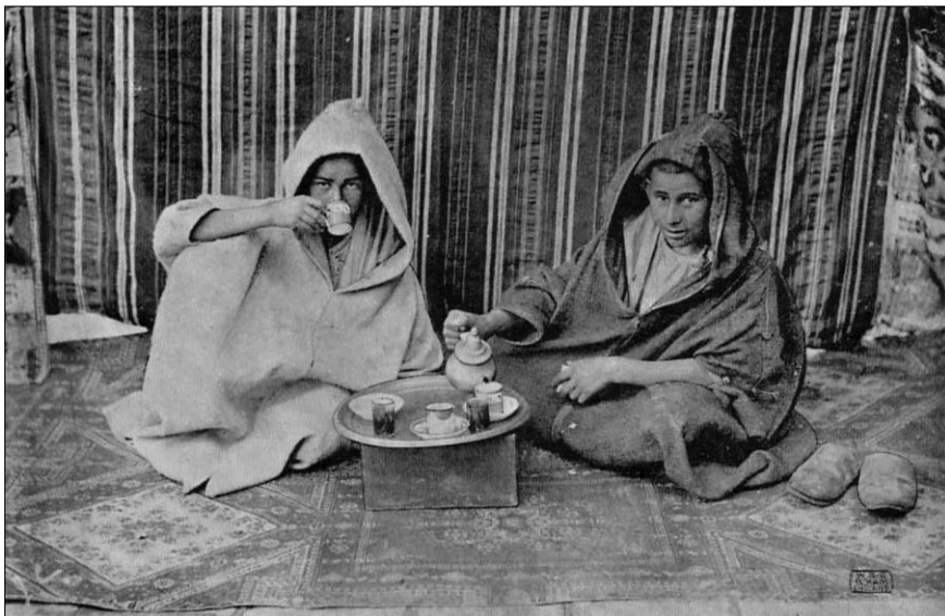
Fig. 4. — Árabes tomando el té (Tarjeta postal: Edición Wilson & Co., colección: José Luis Gómez Barceló).