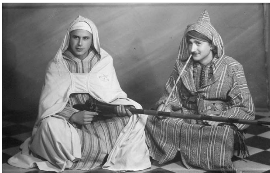
Fig. 5. — Foto de dos personas disfrazadas de marroquíes.