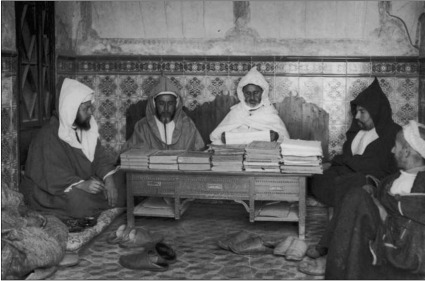
Fig. 8. — Impartiendo justicia

y así pasamos de la figura amable del marroquí dedicado a sus labores a la carnicatura más cruel, pasando por el fiero askari (soldado, militar), para, con la paz, volver a la imagen del culto amanuense, la del cadí que imparte justicia o la de los niños aprendiendo oficios artísticos en las escuelas (fig. 8).