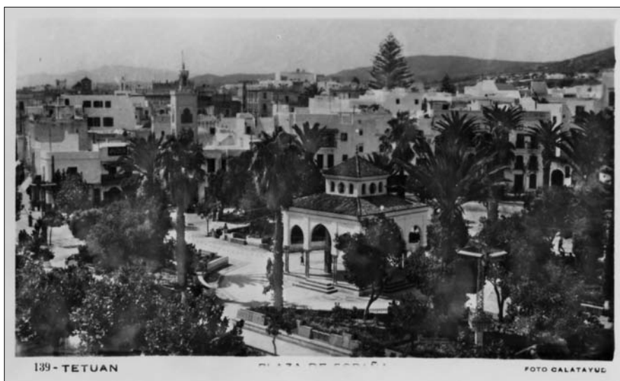
Fig. 9. — Plaza de España, Tetuán

Los militares denominados africanistas tuvieron muy presentes la imagen como medio de difusión de sus ideas. No sólo la imagen fija, sino también el cine. Son conocidas las facilidades dadas por la Legión a cineastas nacionales y foráneos, no solamente para rodar documentales, sino también películas de ficción como Por el honor (memorias de un legionario) de 1929, La Bandera de 1935 o A mí La Legión de 1942 59 . Todo se grababa, todo se fotografiaba, de todo debía quedar testimonio. En ese sentido podría verse la creación de una entidad pionera en el Protectorado Español en Marruecos: la Fototeca del Protectorado.