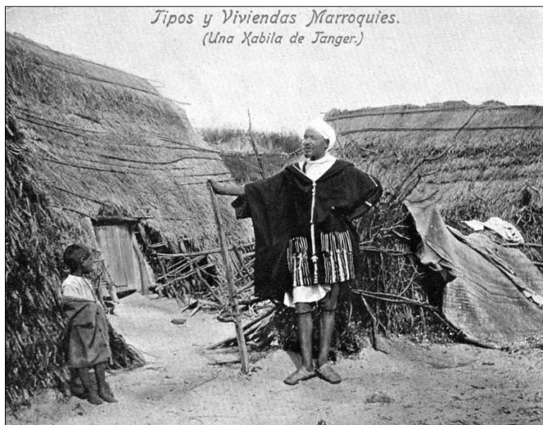
Fig. 6. — Tipos y viviendas marroquíes (Tánger).