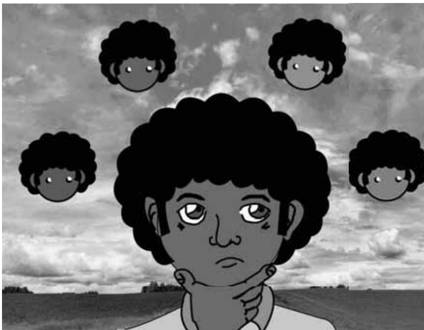
Ilustración (No1) Libro Digital Chile Viste de Colores - Autor: Felipe Inostroza Merino.

Una segunda instancia, es la violencia estética naturalizada en contextos de cotidianidad como la calle, escuela, feria. Por ejemplo cuando Otros tocan el cabello de forma arbitraria. Reflejada en la ilustración (No2).