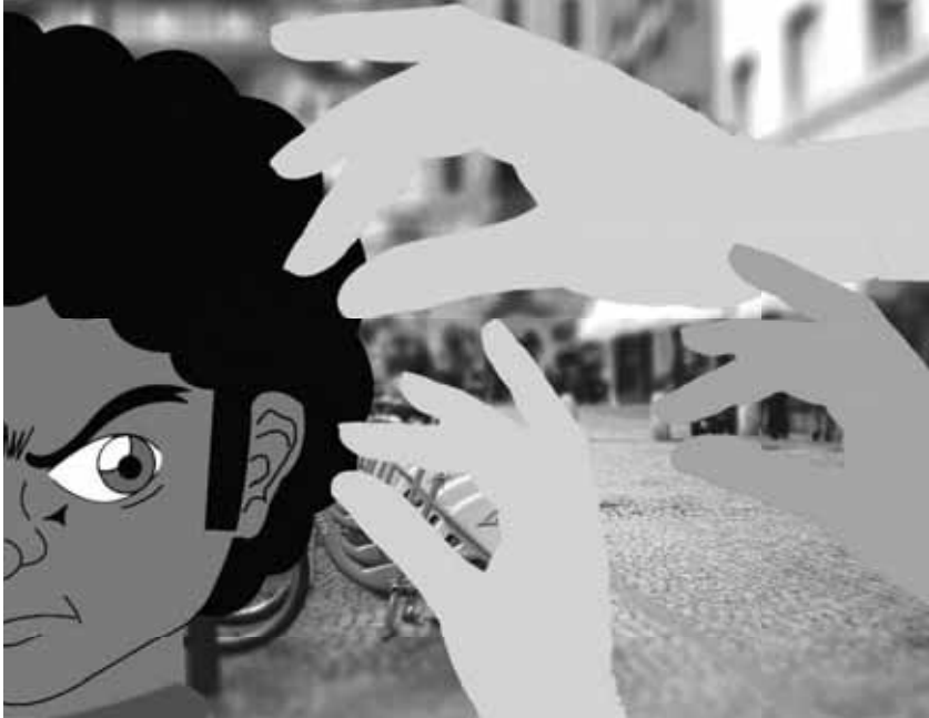
Ilustración (No2) Libro Digital Chile Viste de Colores - Autor Felipe Inostroza Merino.

El libro digital , a través del personaje afro infantil devela el poco respeto hacia un Otro diverso, que la cultura oyente reconoce en un lenguaje no verbal, en el gesto de enojo ante la acción, que se origina en la relación con formas Otras de identidad, como es el caso de las personas afro de origen extranjero que se reconocen desde su país de origen, como tal, realizan un posicionamiento crítico ante esta naturalización (de tocar el cabello), y denuncian en la vivencia de actos de racismo y discriminación.