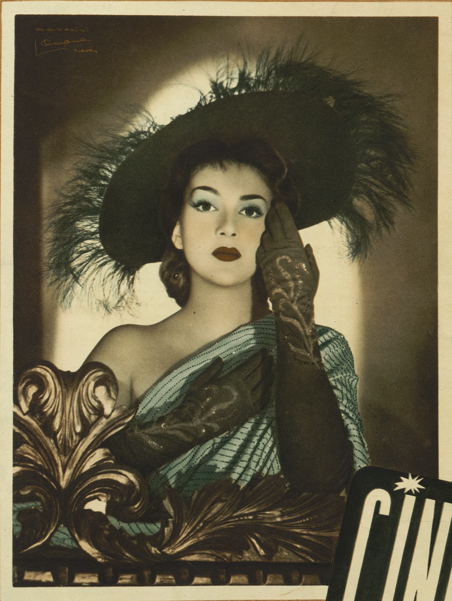
A M P A R I T O R I V E L L E S que, con su exquisita sensibilidad, prolonga la buena escuela dramática de sus padres —los grandes actores María Fernanda Ladrón de Guevara y Rafael Rivelles—, es hoy la primera figura femenina del "cine" español.