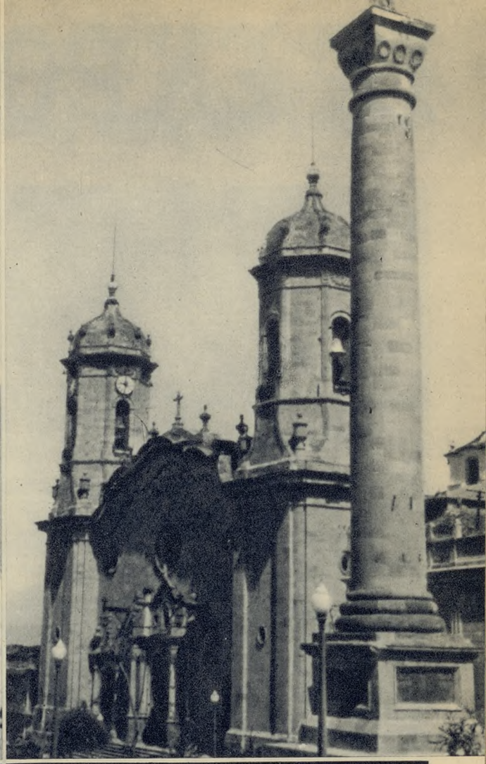
Las torres de la Iglesia Catedral.