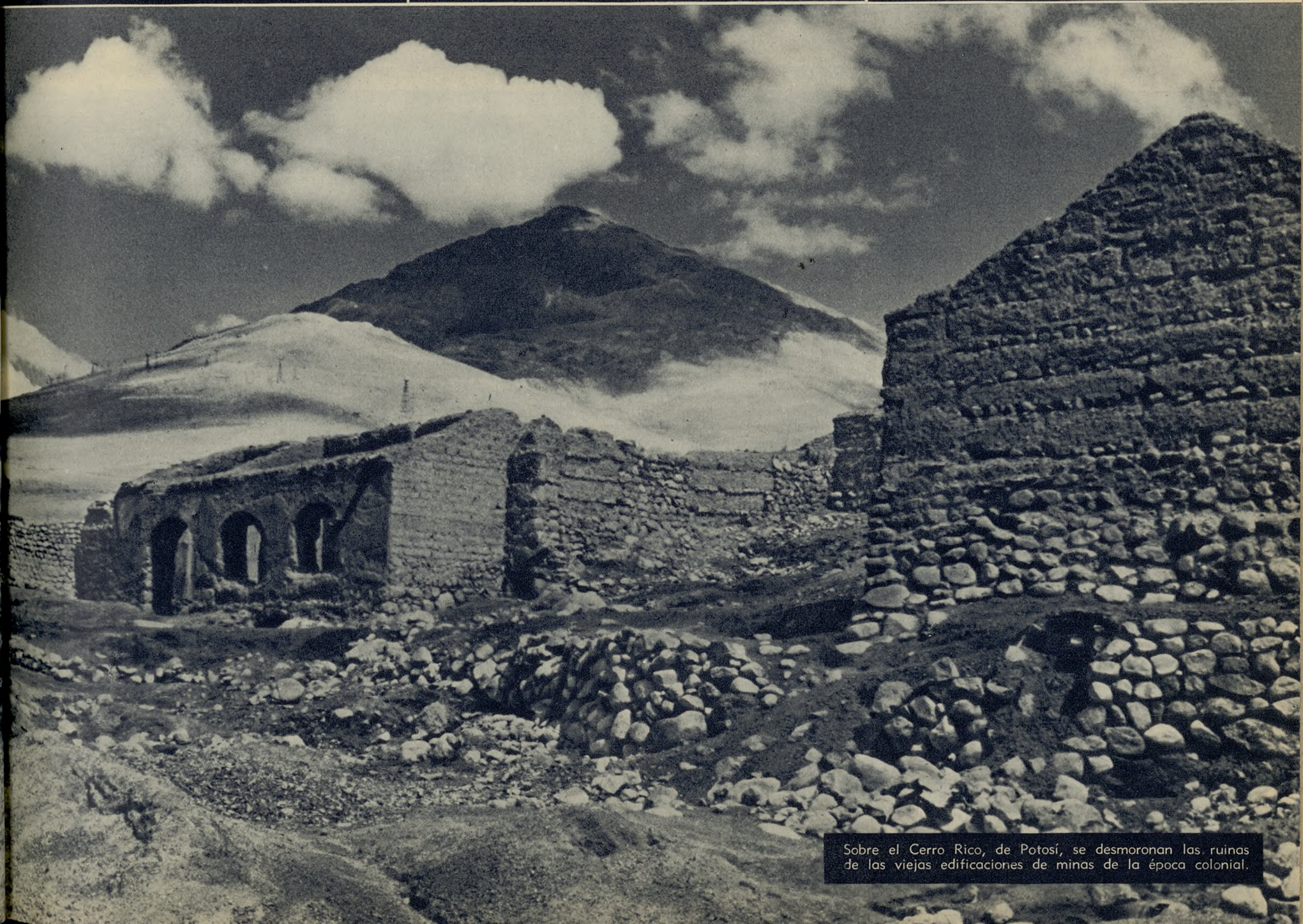
Sobre el Cerro Rico, de Potosí, se desmoronan las ruinas de las viejas edificaciones de minas de la época colonial.