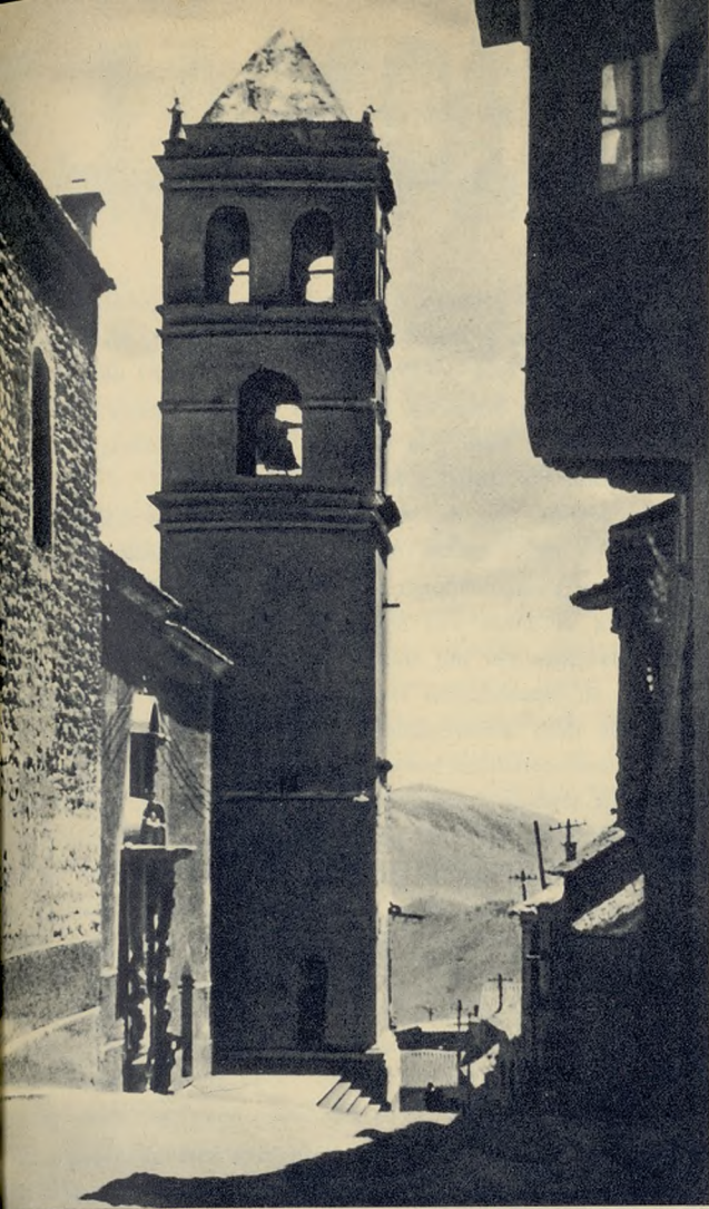
Rincón típico de la villa boliviana.