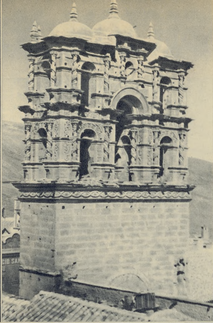
Torre-Espadaña de la iglesia de «La Compañía».