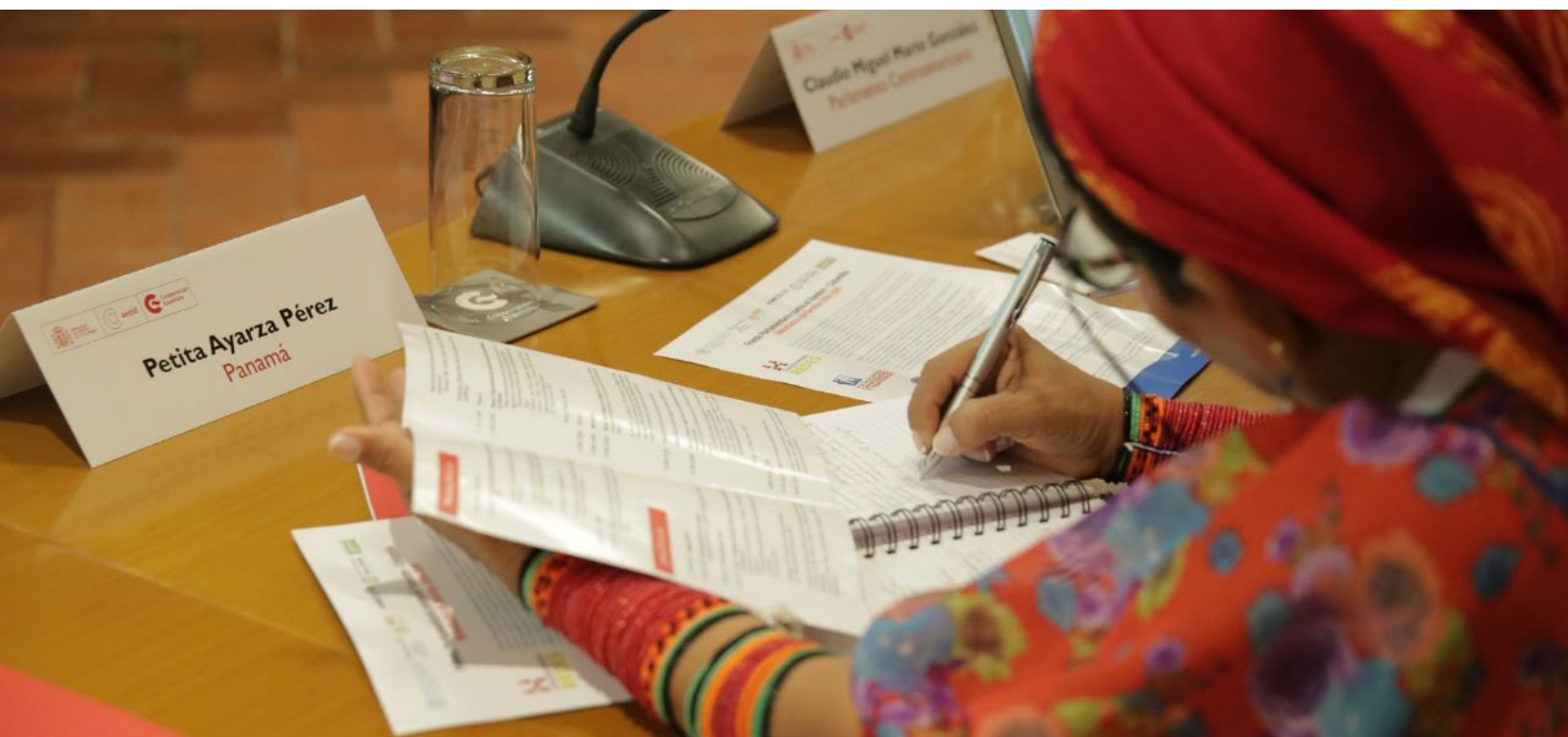
VII Encuentro del Frente Parlamentario contra el Hambre de América Latina y el Caribe - Centro de Formación de la Cooperación Española en Cartagena de Indias, Colombia.