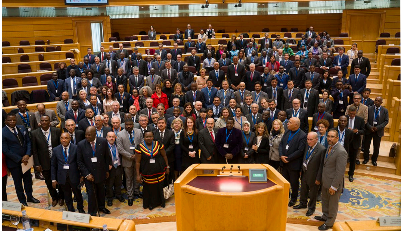
Primera Cumbre Mundial contra el Hambre y la Malnutrición 2018.

la Campaña “Mujeres rurales, mujeres con derechos”, liderada desde la Oficina Regional de la FAO para América Latina y el Caribe. Además, destaca el trabajo coordinado entre el FPH-ALC y la Alianza Parlamentaria Española por el Derecho a la Alimentación, que articula a diversos grupos políticos parlamentarios de las Cortes Generales de España.