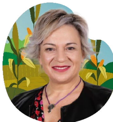
Elena Diego Presidenta Mesa Cooperación para el Desarrollo en Senado España

Deseo agradecer en nombre de la Comisión de Cooperación del Senado de España y de forma especial de la Alianza Parlamentaria por el Derecho a la Alimentación española, de la cual formo parte el poder participar en la presentación de este estudio, a la FAO, al FPH-ALC y al Programa INTERCOONECTA de la Cooperación Española, pues sin ellos este estudio no hubiera sido posible de realizar ¡Vivan las mujeres rurales y las parlamentarias rurales que luchan cada día por un mundo mas justo, libre de hambre y desigualdad!