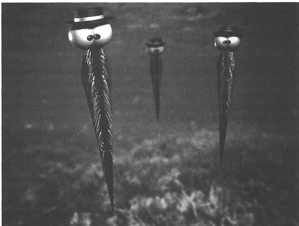
Mundos de estrellas

Lo que va quedando es una obra, sin restricciones. La obra de Germán Arciniegas, el historiador, cronista, periodista, que piensa sobre nuestras gentes y las lleva a ser más seguras y libres sobre sí mismas gracias al asombro con que mira las cosas y al toque poético con que siempre las enriquece, haciéndolas cada día más humanas y más americanas. Más nuestras y más de todos.