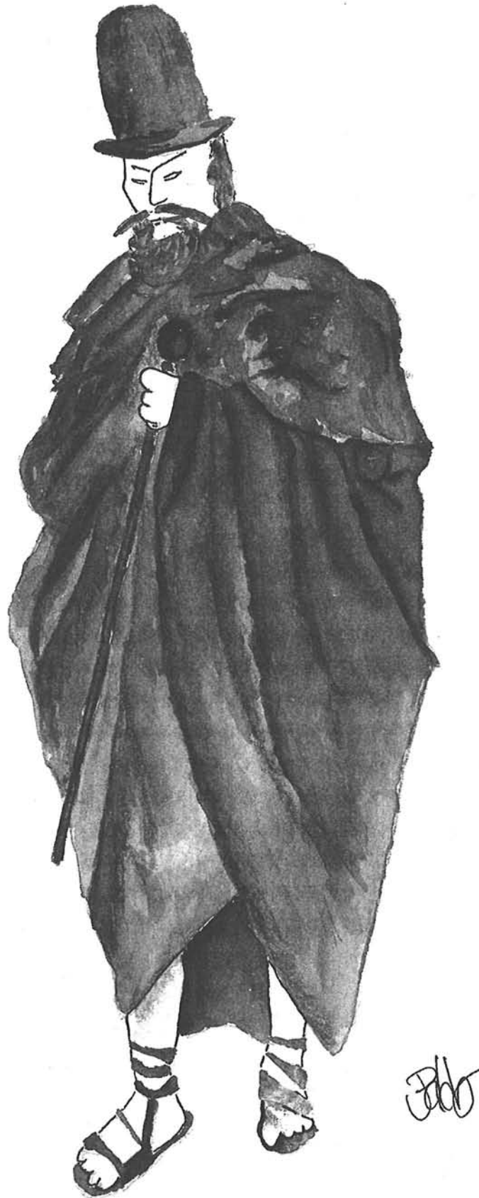
Pablo Guerra: Figurín para El inspector de Gogol