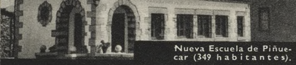
Nueva Escuela de Piñuecar (349 habitantes).