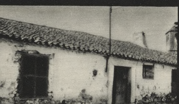
Vieja escuela de Canencia. A 83 Km. de Madrid.