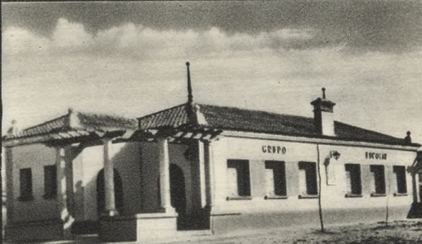
Nueva Escuela de Ajalvir (780 habitantes).