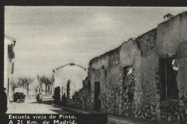
Escuela vieja de Pinto. A 21 Km. de Madrid.