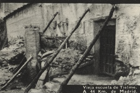
Vieja escuela de Tielme. A 44 Km. de Madrid.