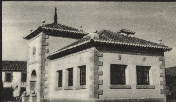
Nuevo Grupo Escolar de Gascones (145 habitantes).