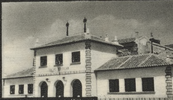
Grupo escolar nuevo de Villarejo de Salvanes (4.380 habitantes).