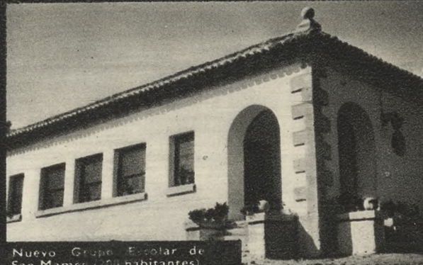
Nuevo Grupo Escolar de San Mames (200 habitantes).