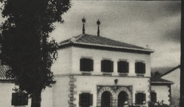
Nuevos Grupos Escolares de Canencia (758 habitantes).