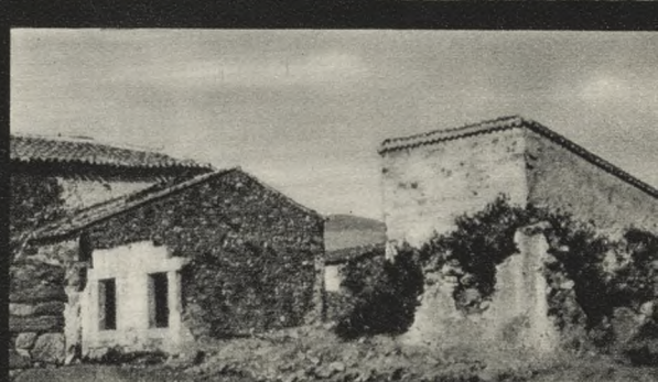
Escuela vieja de Gascones. A 80 Km. de Madrid.