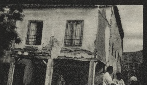
Ayuntamiento viejo de Puebla de la Sierra. A 98 Km. de Madrid.