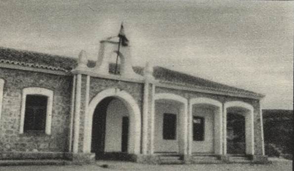
Nueva Escuela de Tielme (1.731 habitantes).