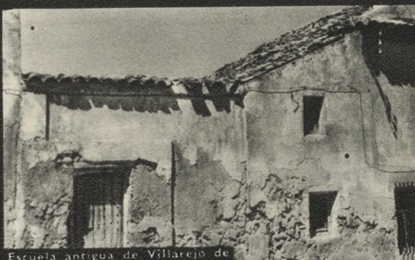
Escuela antigua de Villarejo de Salvanes. A 50 Km. de Madrid.