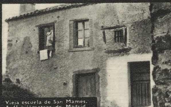
Vieja escuela de San Mames. A 65 kilómetros de Madrid.