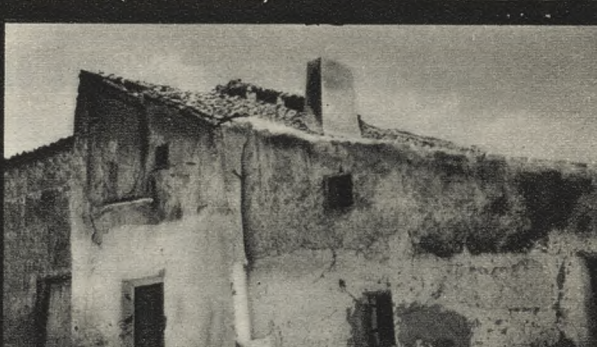
Escuela vieja de Torres de Alameda. A 33 Km. de Madrid.