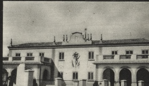
Nueva Escuela de Pinto (3.590 habitantes).