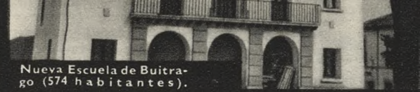
Nueva Escuela de Buitrago (574 habitantes).

JUNTO A LOS LIBROS, LA ORACION, la costura y el deporte, las flores.