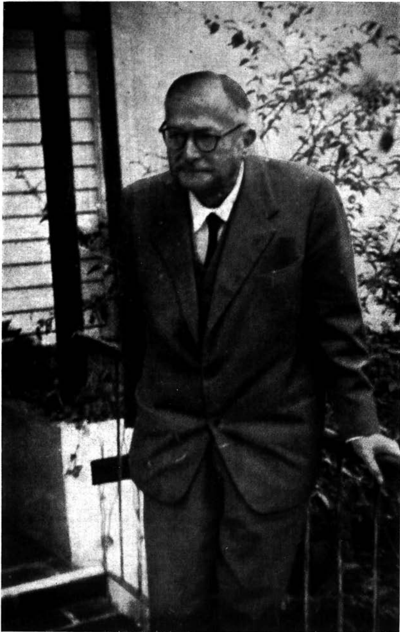
JOSÉ MARÍA CHACÓN Y CALVO, en La Habana, a los setenta y tres años. Julio de 1966