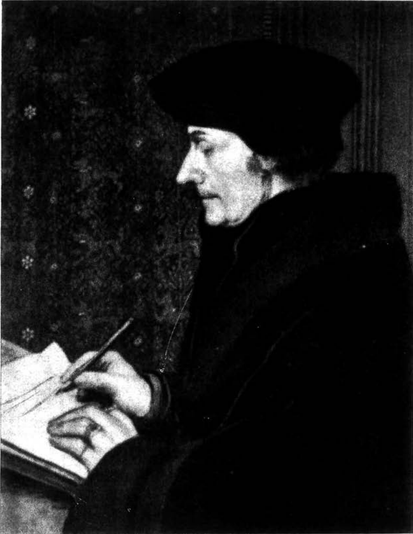
Erasmus, por HOLBEIN