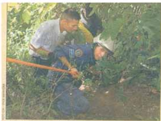
Escabroso ▲ La víctima fue arrojada a 50 metros.