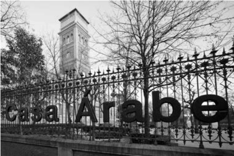
Casa Árabe en el edificio de las Escuelas Aguirre.

La centralidad que, tanto por su proximidad geográfica como histórica, ha jugado y juega el mundo árabe en las relaciones exteriores de España, ha hecho que la diplomacia española desde mediados del siglo XX se haya dotado de herramientas específicas dirigidas a los países árabes.