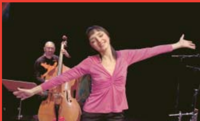
María de Medeiros

X ANIVERSARIO DE IBERMEDIA. Hace diez años se creó el Programa para un Espacio Audiovisual Iberoamericano. Una fiesta en la Casa de América acogerá la ocasión de reconocer la labor de un proyecto que tiene muchos motivos que celebrar: diecisiete países plenamente implicados en proyectos para la producción, desarrollo de proyectos, distribución y formación de profesionales del audiovisual. La regularidad y alta participación en sus convocatorias, así como el número creciente de Estados que desean formar parte y el mantenimiento y renovación de sus compromisos financieros por los que ya lo son, confirman que el programa es todo un éxito. Los resultados lo confirman: la práctica totalidad de los proyectos aprobados en coproducción están rodados y son películas que han participado en los más importantes festivales internacionales de cine. La actuación musical de la actriz y cantante portuguesa María de Medeiros el próximo 30 de noviembre abrirá una fiesta con ritmo latino a la que desde aquí os invitamos a asistir, para celebrar con nosotros que seguimos trabajando por el fortalecimiento de la producción audiovisual iberoamericana en el mundo.