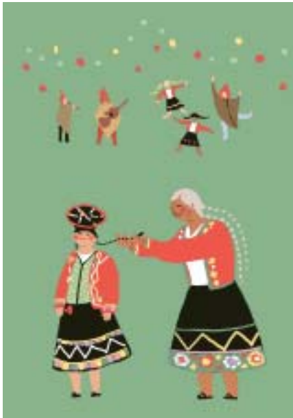
Ilustración: Kira Oriola

comunicación, a los que se ha realizado una importante contribución financiera. En el apartado científico y de preservación del medioambiente, se han fortalecido los programas de cooperación en oceanografía, en bioética, en reservas de la biosfera, en sistemas de alerta temprana y en investigación sobre el cambio climático.