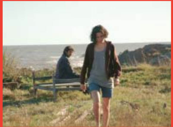
XXY de Lucía Puenzo