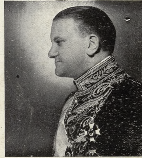
Don Fernando María Castiella, uno de los hombres más significativos de la juventud española, ha sido nombrado embajador de España en Lima, cargo del que ha tomado posesión.