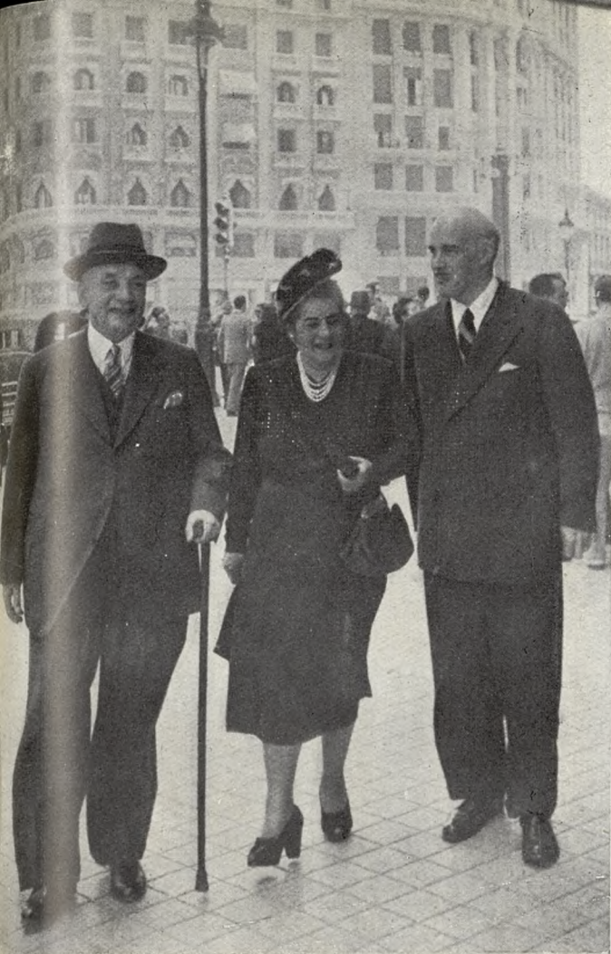
El ilustre político colombiano D. Laureano Gómez— a a izquierda de la fotografía—, acompañado de su esposa, pasea por las calles de Madrid a los pocos días de su llegada a España.