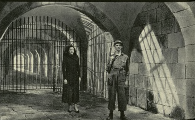
Conducida al Consejo de guerra, Freya Talberg es condenada a muerte. La ejecución se realiza el mismo día en que Ulises muere en su buque, bombardeado y hundido por la aviación del Eje.