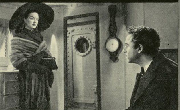
Freya, a la que su propia organización ha denunciado, culpándola de la muerte de von Krammer, visita a Ulises, pidiendo su protección, que éste le niega, porque el hijo muerto les separa para siempre.