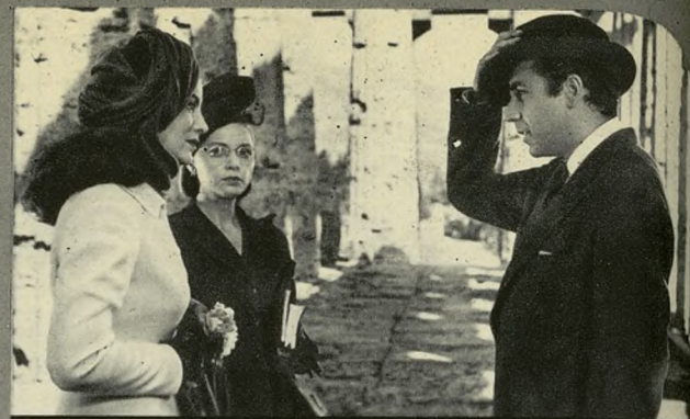
Mientras es reparado en Nápoles su buque, Ulises Ferragut (Fernando Rey) visita las ruinas de Pompeya y Pestum, donde conoce a Freya Talberg (María Félix), mujer de extraordinaria belleza.