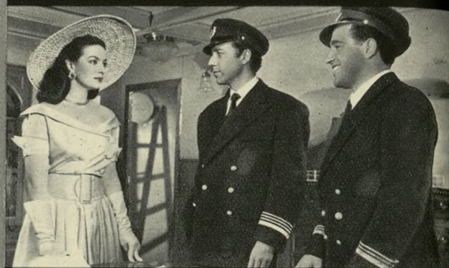
Su presencia en el «Mare Nostrum» llena de orgullo a Ulises y de recelo a su segundo, Toni, que comprende que la excesiva permanencia del buque en Nápoles obedece a la seducción de la extraña mujer.