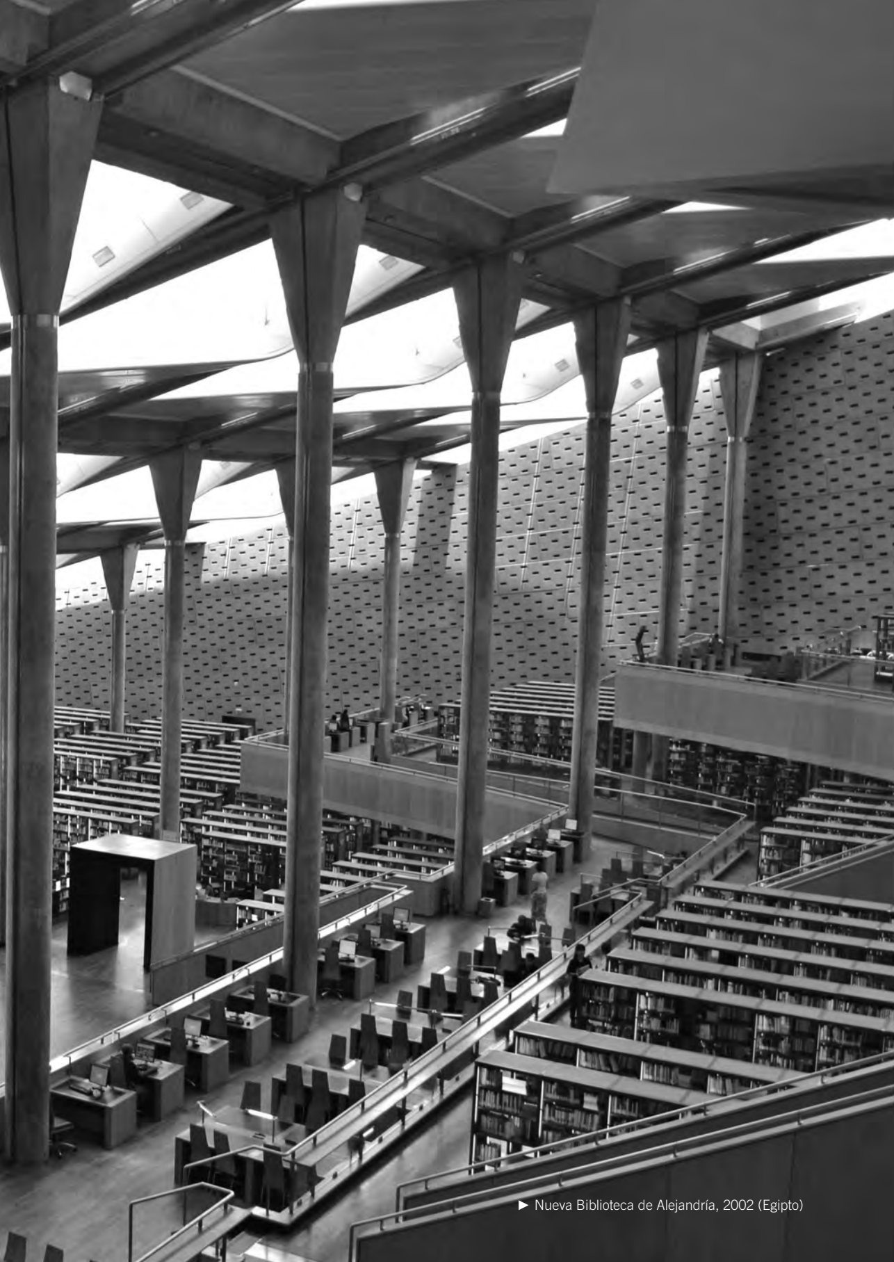
► Nueva Biblioteca de Alejandría, 2002 (Egipto)