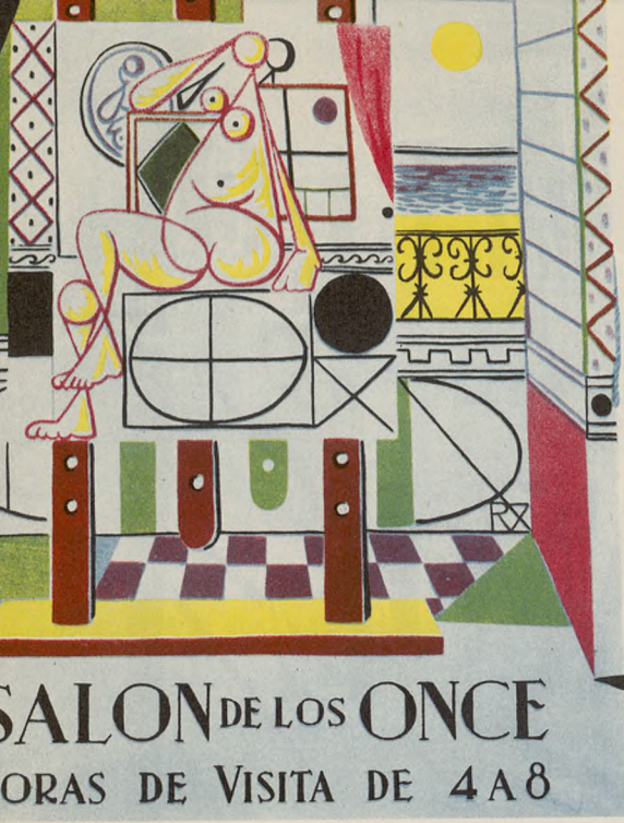
SALON DE LOS ONCE HORAS DE VISITA DE 4 A 8