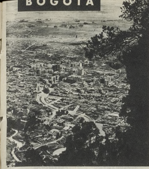
Situación de la ciudad de Bogotá, en vista aérea. En el centro se ve el casco urbano, rodeado por las montañas. En la parte superior se ve el río Bogotá, que atraviesa la ciudad.