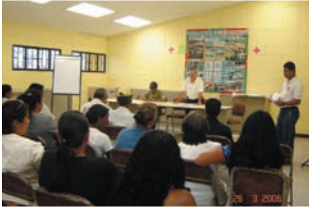
Reunión del Patronato de Ciudad España.

Puede decirse que el trabajo de promoción social es el que ha concentrado mayor esfuerzo después del desarrollado respecto de vivienda y servicios básicos. Las condiciones de formación de los nuevos pobladores del Valle unidas a su escasa experiencia de participación no eran los mejores instrumentos para asumir