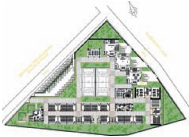
Plano del Instituto Técnico de Támara

modernizado compuesto por aulas de clases, aula de dibujo, talleres, laboratorios de ciencias y de computación, talleres de electricidad, electrónica y estructuras metálicas, área administrativa, sala de profesores, servicios de orientación y enfermería a los estudiantes, biblioteca, reprografía, servicios sanitarios, cancha deportiva.