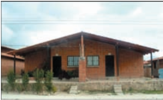
Vivienda financiada por la AECI en Ciudad España.

El proyecto de construcción de 243 viviendas –inicialmente estaban previstas 300- surgió para completar el conjunto de 1.500 casas construidas dentro de una iniciativa compartida con Cruz Roja Hondureña y Cruz Roja Española. Finalmente el total de viviendas acabadas ha sido 1.364.