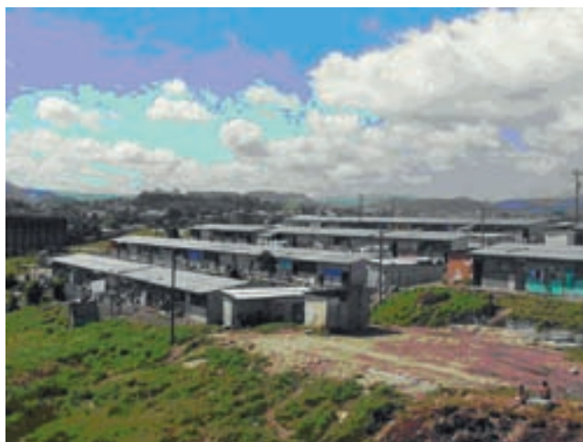
Vista general del macroalbergue El Trébol.

En tanto que el país en general, y su capital en particular, intentaban recuperar la vida cotidiana, en esta ciudad, el fuerte contingente de los más perjudicados, contra lo previsible y deseable, iba a tardar años en recuperar la normalidad; quedando alojados, mientras se les encontraba solución definitiva, en los Centros Habitacionales Temporales, más conocidos por todos, como macroalbergues.