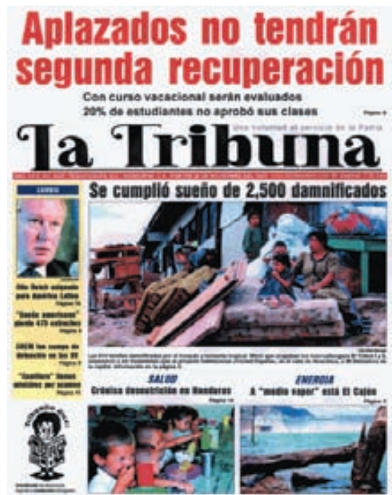
Portada de La Tribuna del 26 de noviembre de 2002 con la noticia del traslado de los damnificados de los macroalbergues a Ciudad España

Desde ese momento los nuevos habitantes del Valle iniciaban, en compañía de las organizaciones que los habían estado apoyando un ciclo en sus vidas –seguramente ya sin vuelta atrás por el número y tipo de experiencias incorporadas-, que, a su vez, no habría de ser ajeno a la población preexistente en Amaratéca.