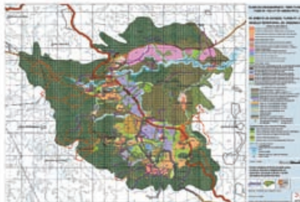
Plano de propuesta del Plan de Ordenamiento Territorial en el Valle de Amaratéca

La primera línea incluye la colaboración de los servicios de Gestión Ambiental, Desechos Sólidos, y Servicios Sociales de la Alcaldía Municipal del Distrito Central, colaboración de facto muy secundaria debido a la dinámica propia de la Alcaldía. Cuenta con la participación satisfactoria del Sistema Autónomo Nacional de Acueductos y Alcantarillado (SANAA).