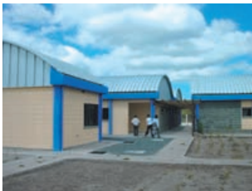
Centro de educación infantil y centro de día para mayores en Ciudad España.

La creación de este Centro responde al objetivo de elevar el capital social básico de Ciudad España mediante la adecuación de infraestructuras y servicios con destino al conjunto de la población, pero también a colectivos específicos, en este caso, dos colectivos no suficientemente atendidos por el marco institucional hondureño.