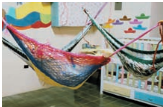
Niños durmiendo en hamacas en el centro infantil Jardín de Ángeles en Ciudad España.

Este proyecto estaba orientado a la mejora del nivel educativo de niños y niñas menores de 6 años, así como de su estado nutricional, poniendo especial atención en quienes presentaban cuadros de desnutrición serios y en aquellos cuyos padres trabajaban sin tener alternativa para el cuidado de sus hijos.