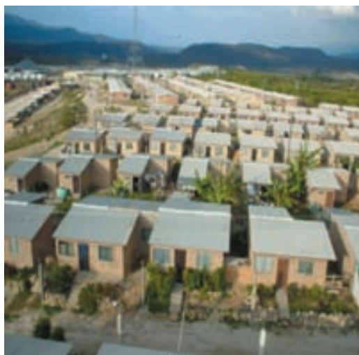
Viviendas en Divina Providencia.

La adjudicación de las viviendas fue hecha sobre la base de un análisis socioeconómico de las familias. Con la encuesta se pretendía obtener información, después de confirmar la condición de damnificado, sobre estructuración familiar; niveles de ingreso; interés real en traslado al nuevo asentamiento; disponibilidad para la capacitación en oficios y actividades productivas; capacidad de relación social y cooperativa; mano de obra empleable en las obras de reconstrucción.