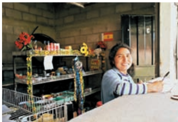
Puesto del Mercado de Ciudad España.

La distancia del Valle de Amarateca, el relativo aislamiento de los asentamientos, la escasa absorción de mano de obra de las fuentes de empleo de la zona, el desempleo de una parte considerable de los nuevos residentes, más su escasa formación y especialización profesional, constituyen los elementos básicos sobre los que se han puesto en marcha las acciones de promoción económica, buscando complementariedades con las desarrolladas respecto de educación y formación ocupacional y promoción social.