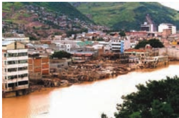
Imagen de los daños provocados por el Mitch en Tegucigalpa

Esta inmediata movilización iba a permitir tempranamente contar con una gran legitimidad para abordar una primera fase de ayuda de emergencia, seguida por una segunda de reconstrucción y generación de intervenciones encaminadas hacia nuevas oportunidades de desarrollo que dejaran atrás los efectos de la catástrofe.