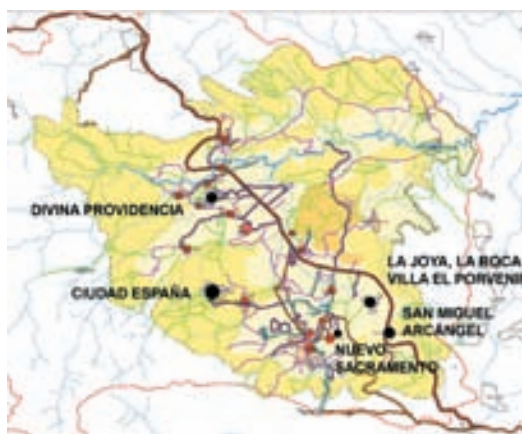
El Valle Amaratéca: sus núcleos de población y los nuevos asentamientos

Asimismo adquirieron distinto perfil desde el punto de vista de la identificación o fuerte asociación que se les atribuyó con las organizaciones que intervinieron en su creación y posteriores desarrollos, bien en lo que se refiere a financiación, bien a construcción, o bien a presencia en programas comunitarios. Traducción de este perfil es el intercambio de nombre dado al asentamiento con el de la organización comprometida con su construcción; como por ejemplo ocurre con el caso de La Joya, asentamiento al que también se le ha denominado oralmente y en documentos Hábitat; o Villa El Porvenir, denominada asimismo bajo el nombre de su organización de apoyo: ADRA.