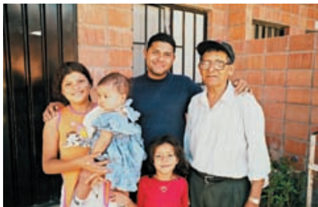
Beneficiarios de Ciudad España a la puerta de su nueva casa.

Como es obvio, este sector ha representado el núcleo central de las intervenciones en Amaratéca hasta el momento de la llegada de los últimos contingentes de damnificados en 2003. Desde el punto de vista inmediato supone el logro de más impacto en cuanto a la mejora de la calidad de vida de las personas beneficiarias, al integrar en la vivienda, electrificación, agua corriente potable y saneamiento. A excepción de Nuevo Sacramento, en donde se utilizan letrinas, actualmente el 100% de estas personas goza de los tres servicios en los