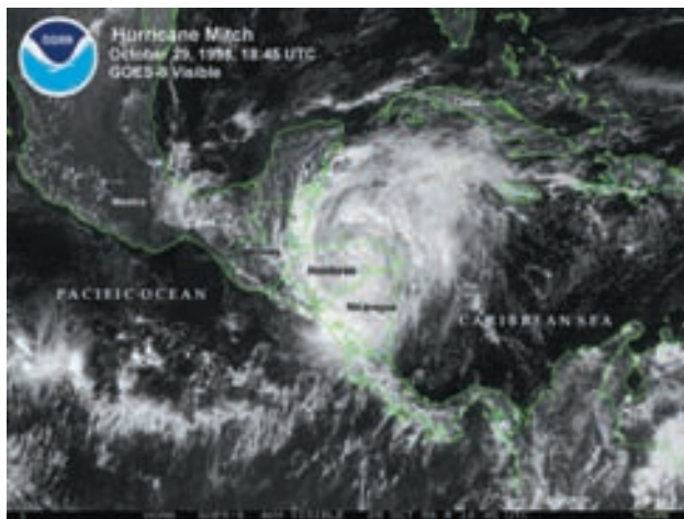
Vista de satélite del huracán Mitch sobre Honduras el 29 de octubre de 1998.

Si el Huracán, en Guatemala, Nicaragua, o El Salvador, había sido devastador en algunas de sus regiones, en el caso de Honduras lo fue en gran parte de su geografía. Familias enteras, viviendas y barrios, infraestructuras de todo tipo, cultivos y ganadería, recursos logísticos..., desaparecieron por completo bajo las lluvias, vientos y barro que concitaron la atención de aquellas jornadas. Y la realidad posterior quedaba