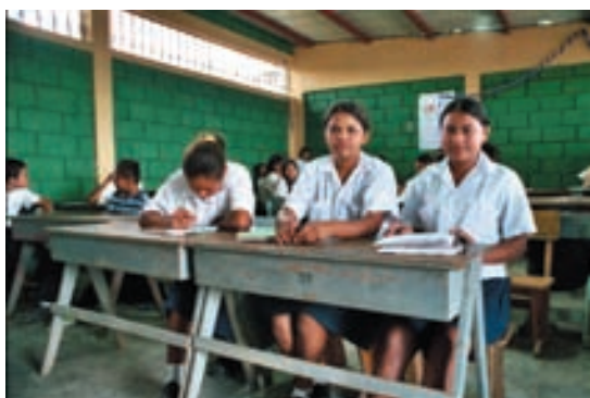
Alumnas de la escuela de El Espinal.

El trabajo en este sector ha combinado intervenciones a nivel de educación formal, integrándolas en el marco del sistema nacional de educación, administrado por la Secretaría de Educación, y a nivel informal, creando infraestructuras y servicios complementarios a los incluidos en el sistema educativo. De esta manera, actualmente los habitantes del Valle cuentan con actuaciones de educación temprana, guardería, educación primaria, educación secundaria, formación ocupacional o vocacional y experiencias de educación de adultos.