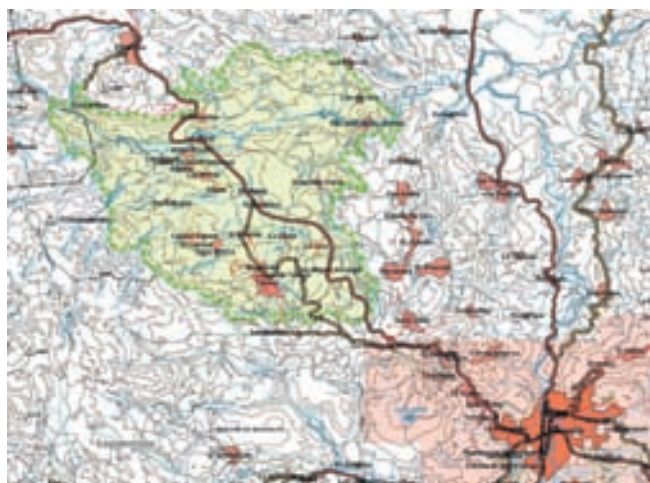
Ubicación del Valle de Amarateca y sus poblaciones respecto a Tegucigalpa

Tras múltiples análisis sobre terrenos disponibles y sobre el modelo de alojamiento bajo el que debía reinstalarse el grueso de los afectados -aquellos que habían perdido sus casas, quienes, aun pudiendo haber seguido viviendo en ellas a pesar de los daños, continuaban en zona de riesgo ante nuevas riadas, y quienes además de todo ello sufrían discapacidades-, las Autoridades hondureñas adoptaron la decisión de destinar el Valle de Amarateca para la ubicación definitiva de la población damnificada. Este Valle, como hemos dicho, forma parte del Distrito Central, mismo municipio al que pertenece Tegucigalpa,