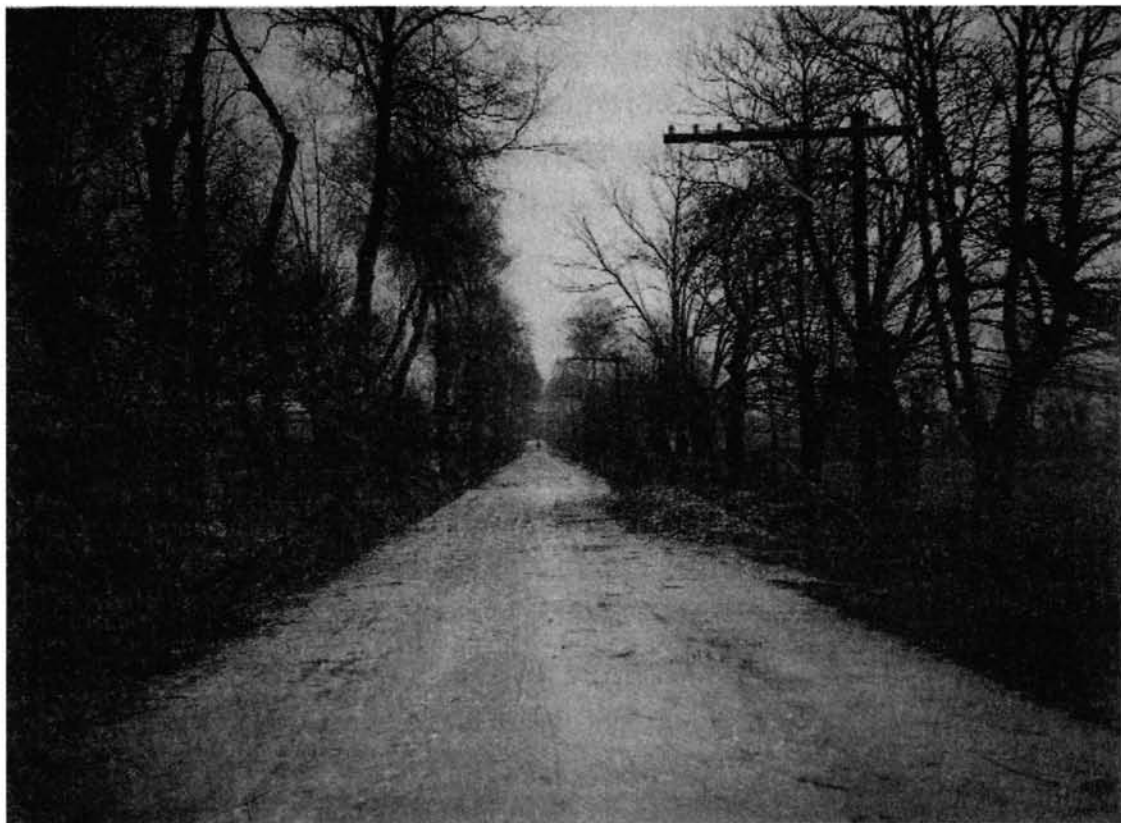
Marín, 1928. León-Santiago Km. 27

lengua en la que nos aproximáramos a ella en el siglo XXI, pero confió en que otros seres humanos la interpelaran desde el entonces desértico mundo del futuro.