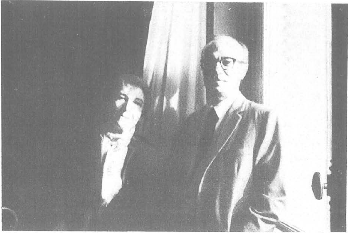
Ernesto Sábato y Nathalie Sarrante (París, 1970)