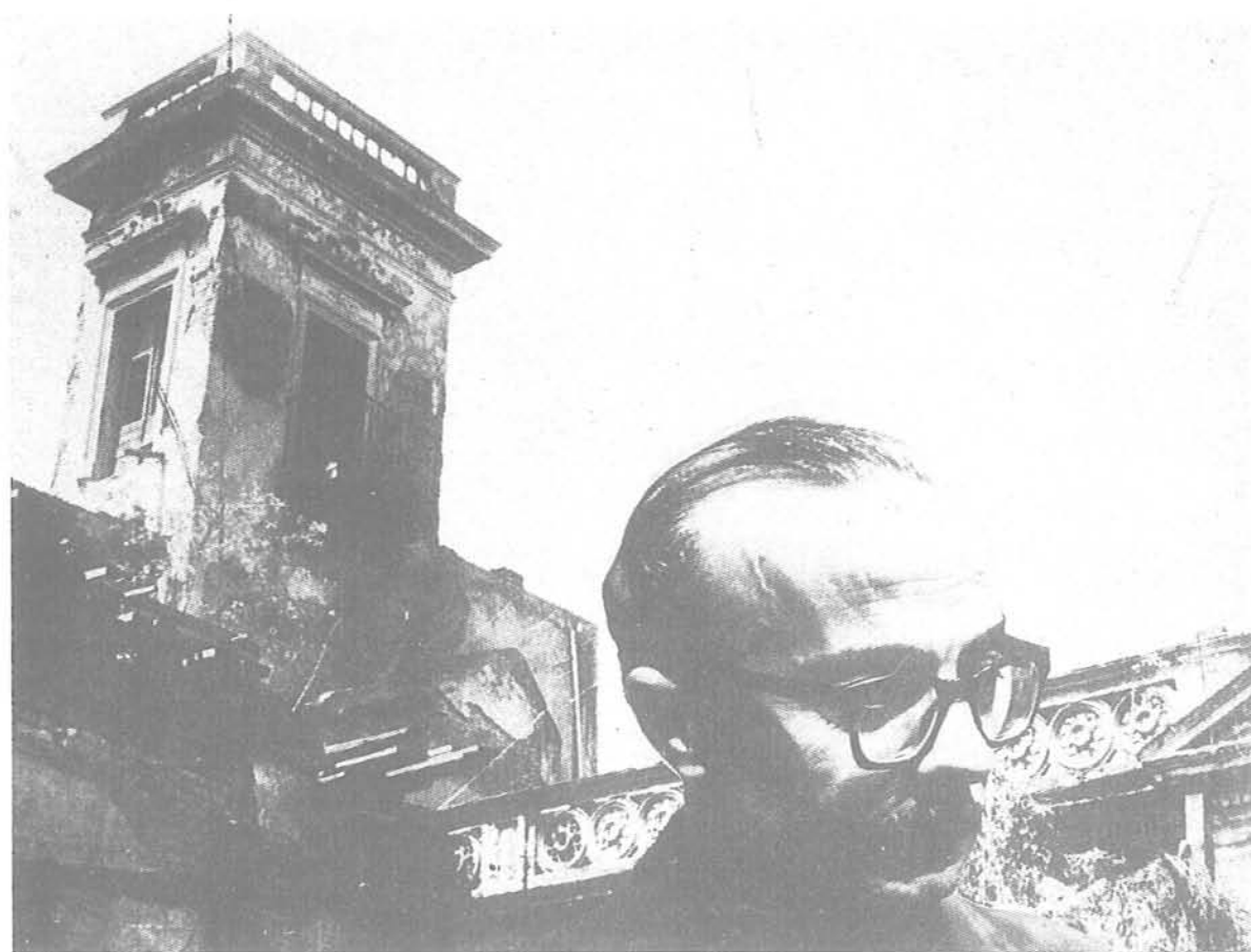
Frente a la casa de Hipólito Irigoyen, esquina Virrey Liniers, en Buenos Aires