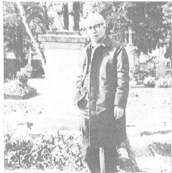
Junto a la tumba de Hölderlin (Tübinga, 1977)