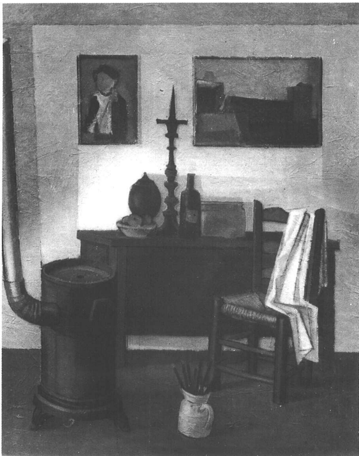
VALLS: «Interior del taller» (1953). Colección Antonio Mira, Toledo.