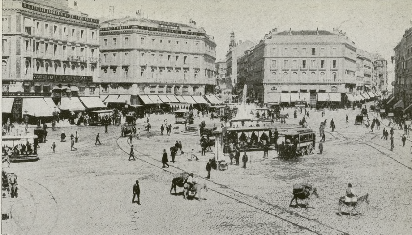
LA PUERTA DEL SOL DEL 1891. UN SURTIDOR EN EL CENTRO. TRANVIAS DE MULAS. PLACIDEZ: SEÑORES CON HONGO Y ARRIEROS CON CARROS CARGADOS... ALDEA Y CORTE. BARRENDEROS Y BOHEMIOS EN EL AMANECER, CAFE CON LECHE DE LA PUERTA DEL SOL...

Con el mentidero de San Felipe, es decir, las gradas, desapareció el lugar del gran cotilleo madrileño del siglo XVII. Enfrente de él murió asesinado el Conde de Villamediana, el perfecto dandy encantador, agresivo y opulento, refinado... y que fué enterrado dentro de una caja de las utilizadas para los condenados a muerte por delitos de sangre, y traída a toda prisa de la cercana iglesia del Carmen, que hoy es la única que se mantiene en pie entre las de la más próxima