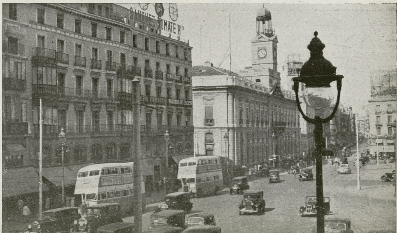
LA GENTE CANALIZADA POR LAS ACERAS Y NADA DE TRANVIAS, QUE HAN SIDO SUPRIMIDOS... AUTOBUSES Y AUTOMOVILES: LA PRISA DE LLEGAR CINCO MINUTOS ANTES. LA PUERTA DEL SOL RIE DE ESTA URGENCIA CAMINO DE NINGUNA PARTE. SON LAS ONCE Y VEINTE: ¡AY, YA SE MIRA LA HORA!