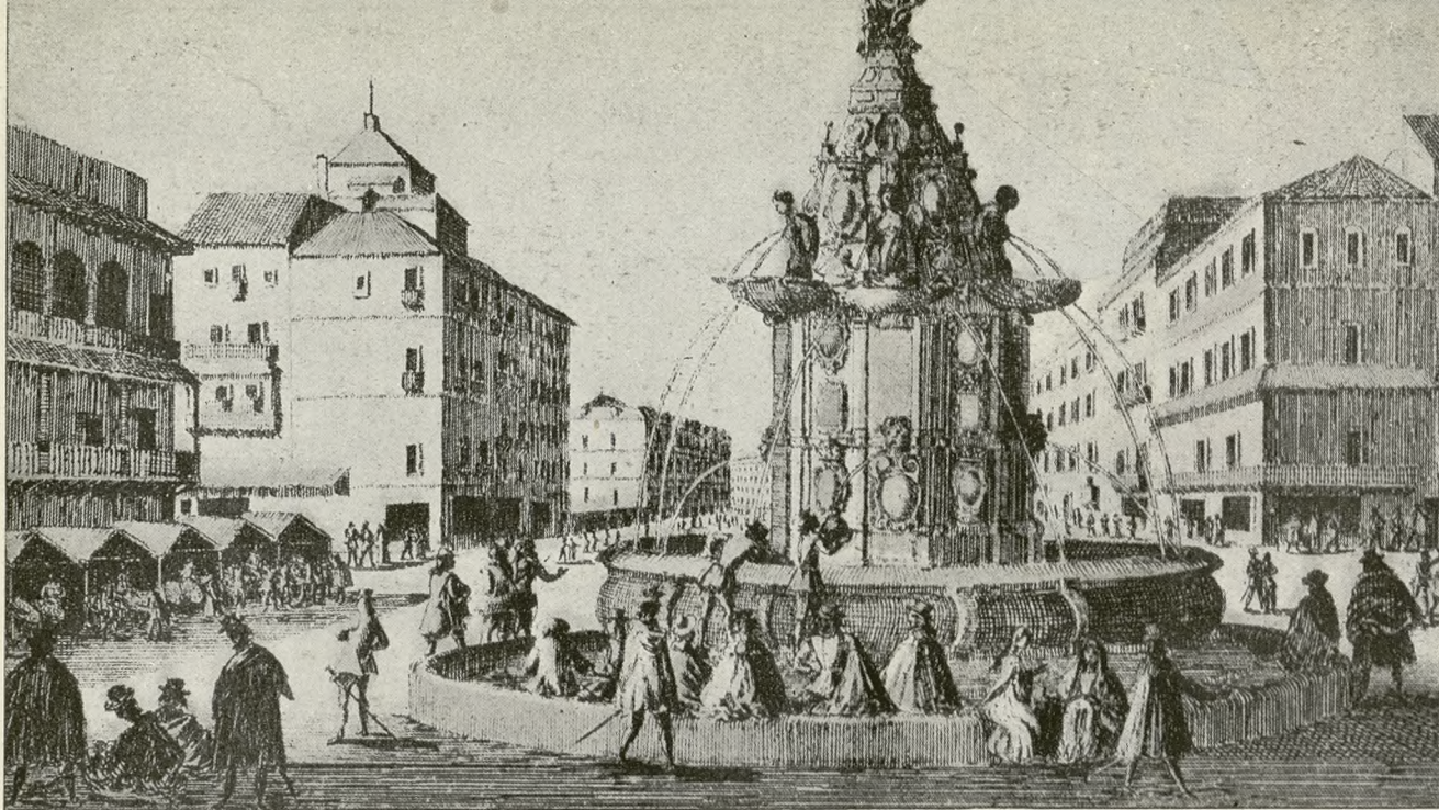
UN MADRID EN SU SALSAS ANTIGUA CON REPOSO AUSTRIACO. ALREDEDOR DE LA FUENTE DE LA MARIBLANCA ESTA YA EL GRUPO SEMPITERNO DE LOS CONTERTULIOS. SIGLO XVII O EL RUMOR: LANCES NOCTURNOS DE AMOR Y DE ESPADA CRECIDOS EN LA CONVERSACION MANANERA