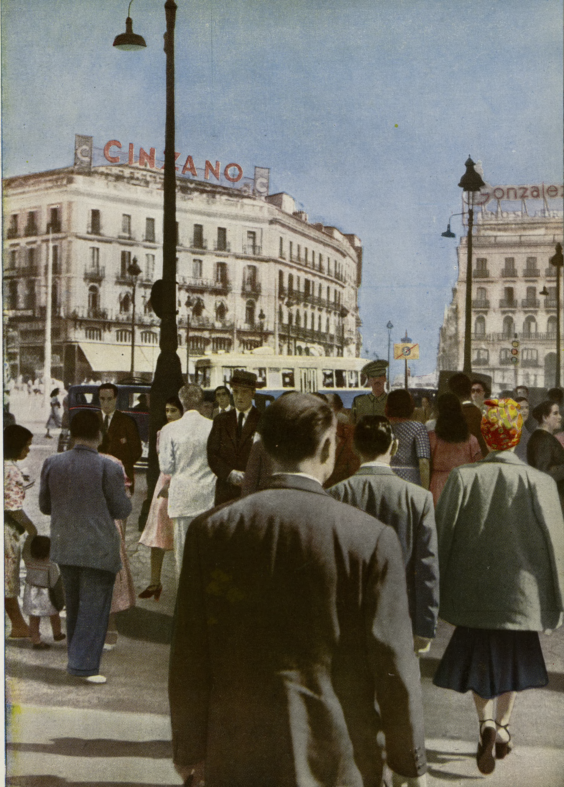
LOS MADRI- LEÑOS QUE HOY LA CRU- ZAN SON LOS MISMISIMOS DE SIEMPRE, ENTENDIEN- DO POR MA- DRILEÑOS A TODOS LOS QUE POR ALLI PASAN A CADA MI- NUTO.