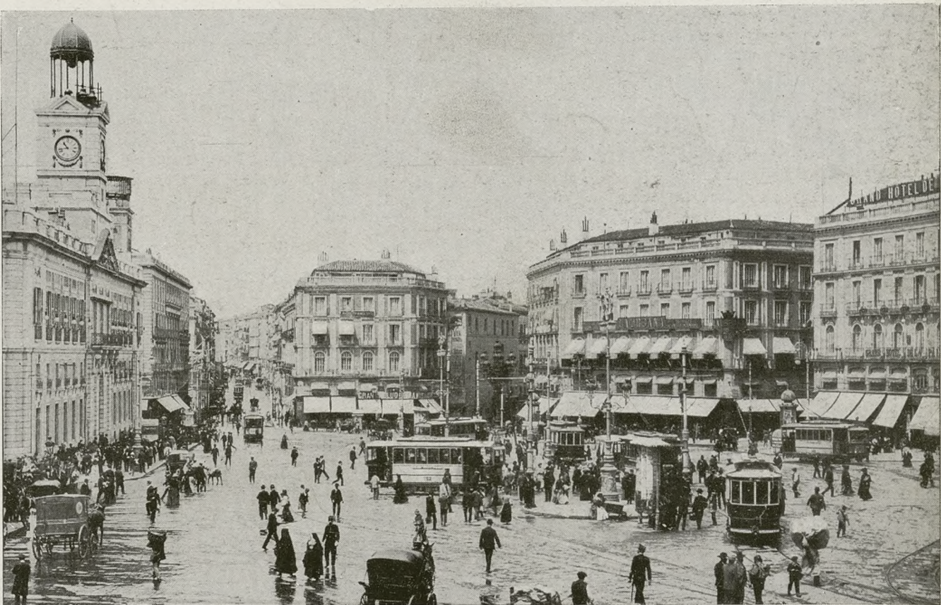
LA PUERTA DEL SOL CON TRANVIAS ELECTRICOS, CARTELERAS Y "W.-C."... ¡EL COLMO DEL URBANISMO CON TODOS LOS DETALLES! HASTA ALGUN GUARDIA DE LA CIRCULACION, HASTA TOLDOS EN LOS BALCONES... ¡EL RESPETABLE SIGLO XX HA LLEGADO!