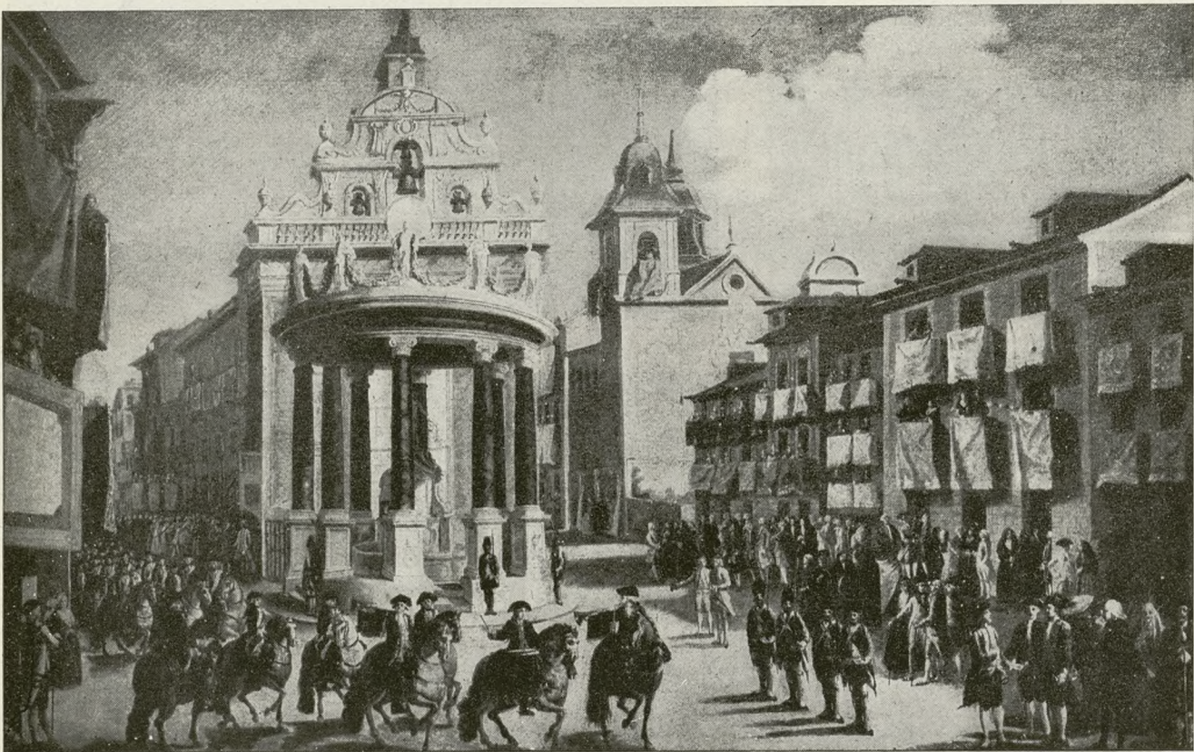
LA IGLESIA DEL BUEN SUCESO ADORNA SU FACHADA DE LA PUERTA DEL SOL PARA UNAS FIESTAS REGIAS EN HONOR DE DON CARLOS III. SIGLO XVIII: MADERA PINTADA DE MARMOL Y CABALLOS QUE PARECEN PINTADOS. REPOSTEROS Y CLARINES, PELUCAS EN LA PLAZA POPULAR...