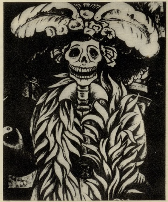
«LA CALAVERA CATRINA DE POSADAS» (FRAGMENTO DE UN MURAL DEL PINTOR DIEGO RIVERA)

El indígena piensa que debe estar agradecido con los que antes que él vivieron, porque a ellos debe la vida misma y la situación y bienes de que disfruta. Debe, por tanto, corresponder a los servicios que ha recibido, tratando de comportarse