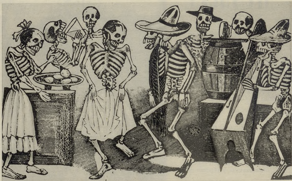
ESTADO DE JALISCO.—«ORQUESTA DE MUERTOS». FIGURILLAS DE BARRO COCIDO Y POLICROMADO, BURLA O DESPRECIO DE LA MUERTE, POPULARES EN AQUELLA REGION MEJICANA

Así también la reproducción de escenas, las más importantes de la vida real, en que se descarna a quienes en ella participan, para presentarlos como esqueletos o como calaveras.