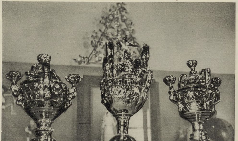
PEBETEROS VIDRIADOS DE BARRO COCIDO, DEL ESTADO DE PUEBLA, DE MANUFACTURA INDIGENA, QUE SE PONEN A LA VENTA EN LAS VISPERAS DEL DIA DE LOS DIFUNTOS.

M I G U E L C A S T R O R U I Z (DEL I CONCURSO DE REPORTAJES «MUNDO HISPANICO».)