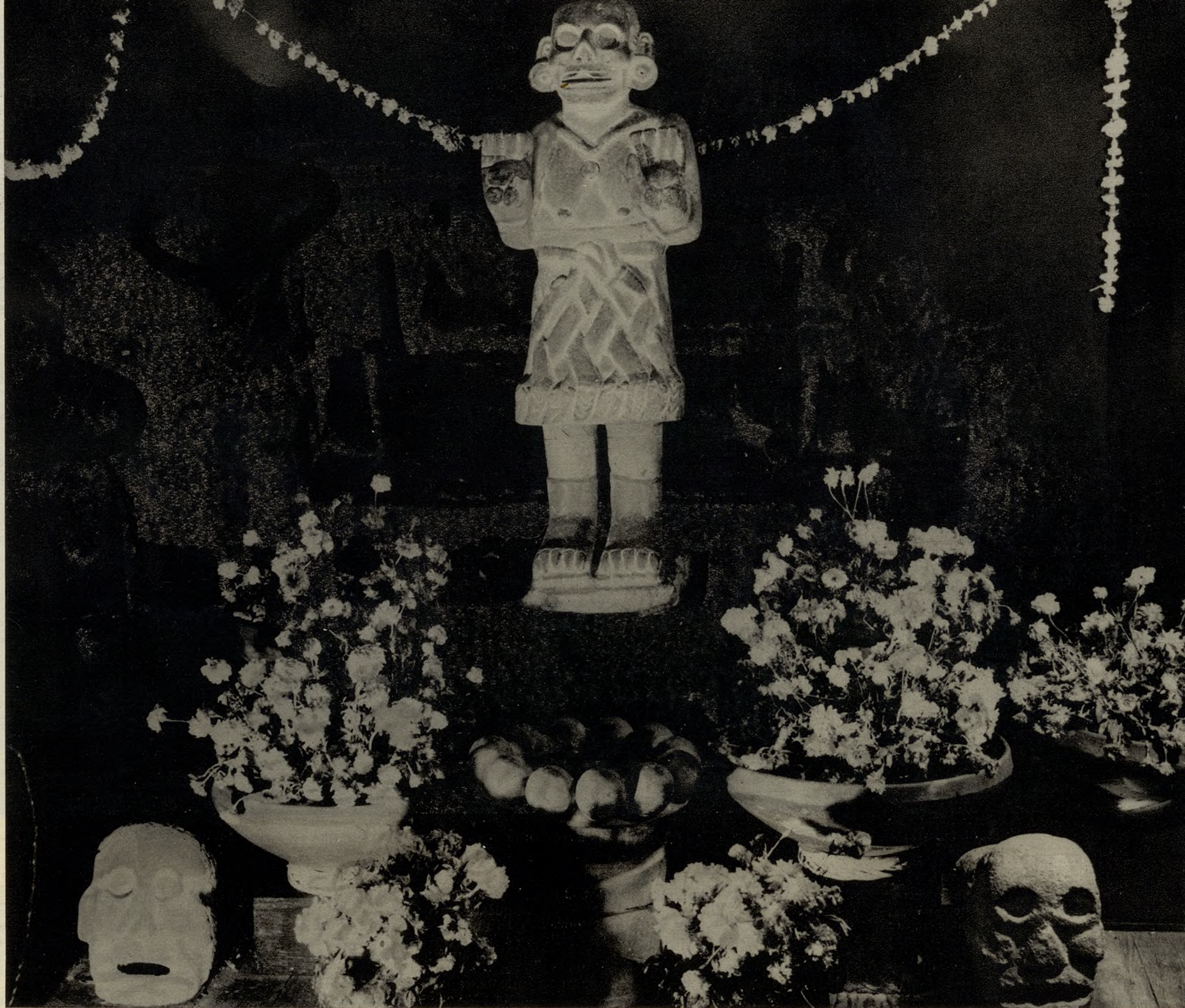
ESTATUILLA TÍPICA DE LA DIOSA COA- TLICUE, LA DIVINIDAD AZTECA DE LA TIERRA QUE ESPERA EL RETORNO A ELLA DE LOS HUMA- NOS DES- PUES DE LA MUERTE