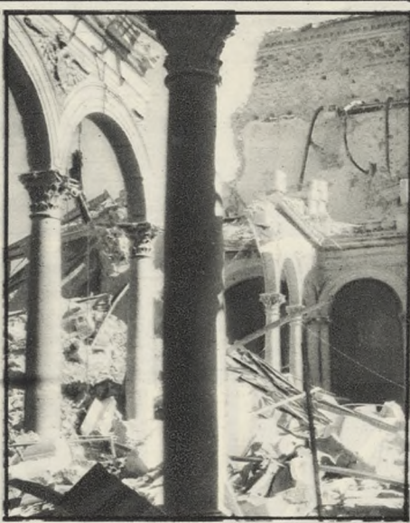
Arriba: Hermoso patio, de Covarrubias, casi desaparecido. Abajo: Fachada Sur, de Juan Herrera, única que quedó en pie.