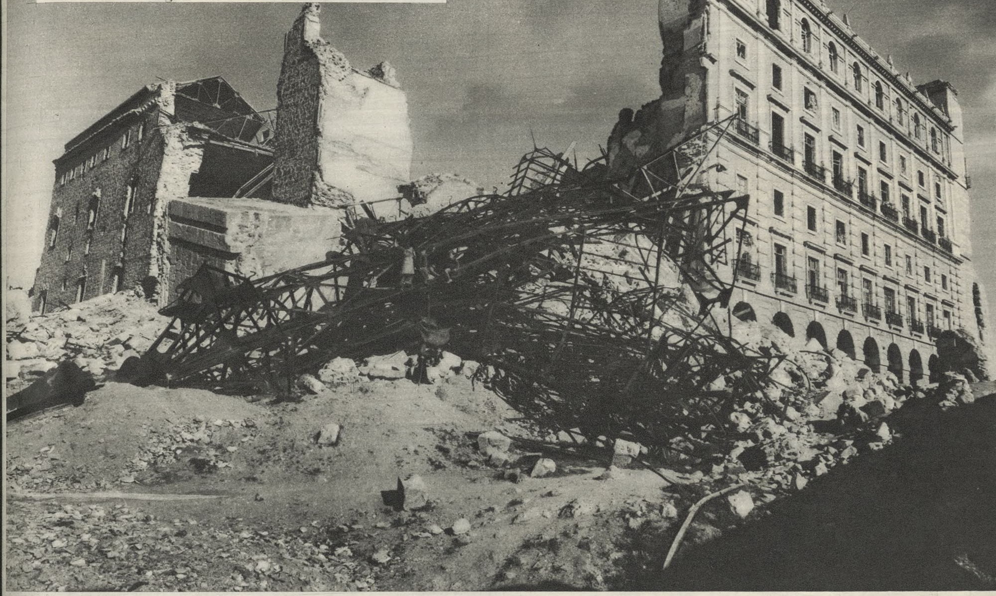
La primera mina, seis toneladas de dinamita bajo el torreón S. O., derrumbó todo un ángulo del castillo toledano. Sobre la ciudad llovió piedra durante minuto y medio