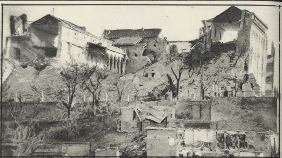
En esta fachada, la norte, hicieron blanco —en un sólo día— 472 cañonazos del calibre 15,5. El asalto de la milicia marxista fué, sin embargo, rotundamente rechazado.