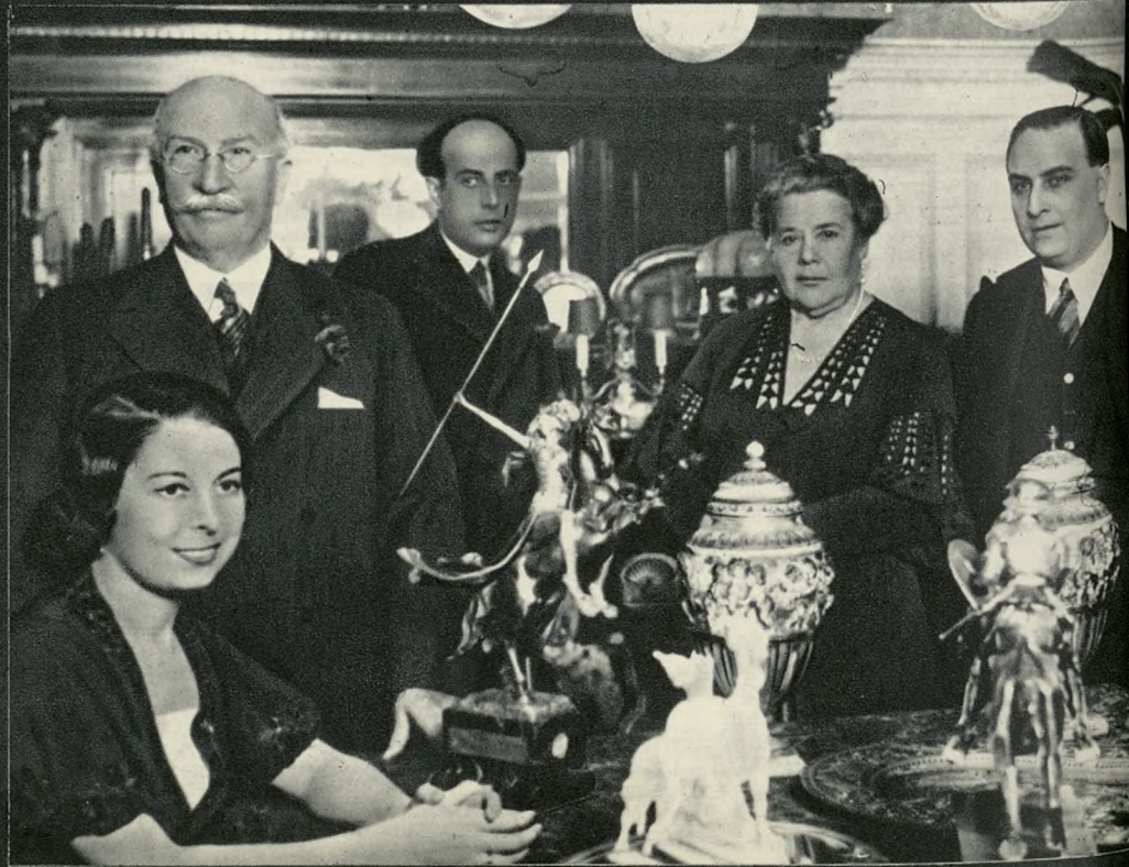
Abajo: A la izquierda, don Alejandro Lerroux en la intimidad de su vida familiar, con su esposa y sus hijos.—A la derecha, don Alejandro Lerroux, rodeado de los periodistas, después de haber sido designado para presidir el Gobierno, en 1935.